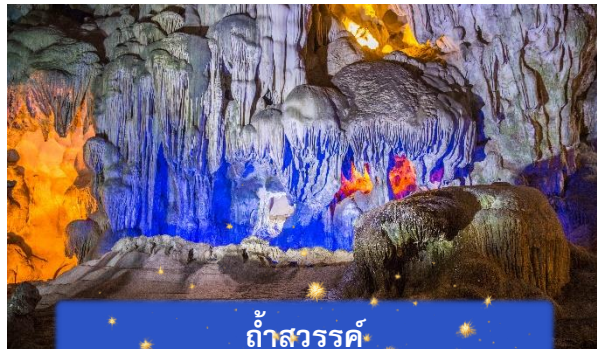
ถ้ำสวรรค์