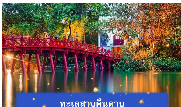
ทะเลสาบคินดาบ

ที่พัก A25 HOTEL ระดับ 4 ดาวมาตรฐานท้องถิ่น หรือเทียบเท่า