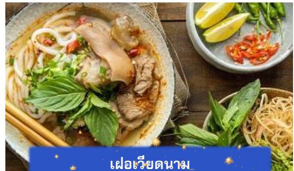
เฟอเวียดนาม

เที่ยง บริการอาหารกลางวัน ณ ภัตตาคาร พิเศษ ... เมนูเฟอไก่เวียดนาม ได้เวลาอันสมควรนำท่านเดินทางเข้าสู่ สนามบินนอยไบ เพื่อเดินทางกลับประเทศไทย 15.55 นำท่านเดินทางสู่ สนามบินสุวรรณภูมิ ประเทศไทย เที่ยวบินที่ VN619 (บริการอาหาร และเครื่องดื่มบนเครื่อง)