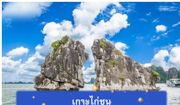
เกาะไก่ชน

เที่ยง บริการอาหารกลางวัน ณ ภัตตาคาร พิเศษ ... เมนูซีฟู้ดบนเรือ