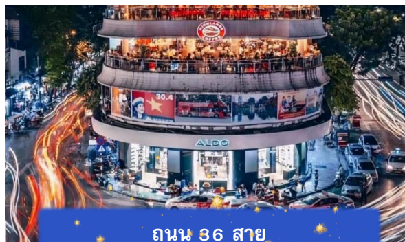
ถนน 36 สาย