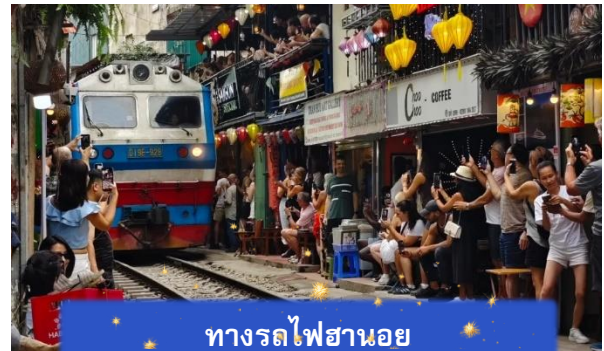
ทางรถไฟฮานอย

เช้า บริการอาหารเช้า ณ ห้องอาหารของโรงแรม นำท่านเดินทางสู่ วัดเจ็ญก๊วก วัดริมทะเลสาบที่เก่าแก่ที่สุดในฮานอย สงบ สวย และ สะท้อนวัฒนธรรมเวียดนามได้อย่างลึกซึ้ง หลังจากนั้นนำท่านเดินทางสู่ ทางรถไฟฮานอย เป็นแหล่งท่องเที่ยวที่ได้รับความนิยมในกรุงฮานอย ประเทศเวียดนาม จุดเด่นของที่นี่คือ ทางรถไฟที่วิ่งผ่านย่านชุมชนที่อยู่อาศัย ทำให้เกิดภาพวิถีชีวิตที่แปลกตาและเป็นเอกลักษณ์ ท่านสามารถทดลองชิมกาแฟแท้ๆจากเวียดนามได้ที่นี้ อาทิ กาแฟนมเวียดนาม ที่มีความเข้มข้น กาแฟไข่มุกรุ่นนวลหอมละมุน หรือกาแฟเกลือที่ทำให้ความรู้สึกแปลกแต่อร่อย อย่างบอกไม่ถูก (ไม่รวมค่าเครื่องดื่ม)