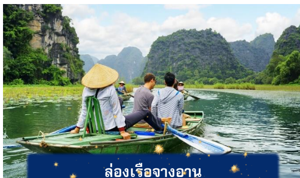
ล่องเรือจางอัน