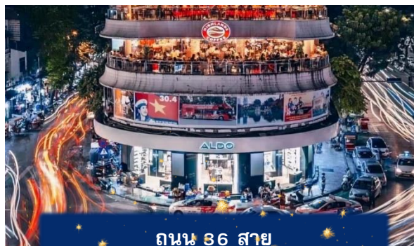
ถนน 36 สาย