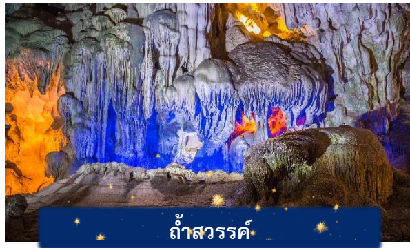
ถ้ำสวรรค์