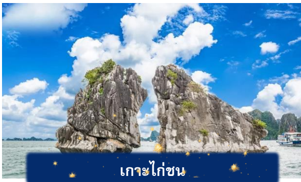
เกาะไก่ชน

เที่ยง บริการอาหารกลางวัน ณ ภัตตาคาร พิเศษ ... เมนูซีฟู้ดบนเรือ