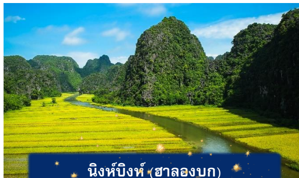
นิงห์บิงห์ (ฮาลองบก)