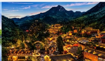
หุบเขาเทวดาหวังเซียนกู่