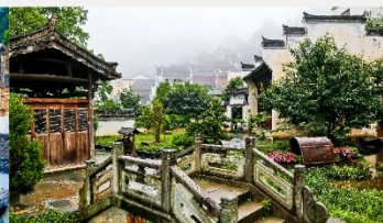
ถนนน้ำอวาชี่

*ทางบริษัทฯ ขอสงวนสิทธิ์ในการสลับโปรแกรมทัวร์ตามความเหมาะสมขึ้นอยู่กับสถานการณ์หน้างาน โดยคำนึงถึงผลประโยชน์ของลูกค้าเป็นสำคัญ