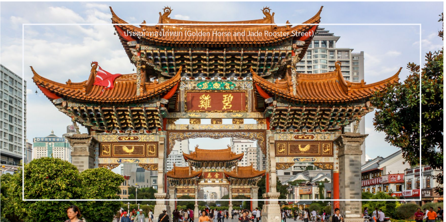
ประตูม้าทองไก่หยก (Golden Horse and Jade Rooster Street)

อิสระช้อปปิ้งถนนคนเดิน ประตูม้าทองไก่หยก (Golden Horse and Jade Rooster Street) หรือ ถนนหนานผิงเจีย เป็นแหล่งช้อปปิ้งที่มีชื่อเสียงในเมืองคุนหมิง (Kunming) สถานที่นี้เป็นที่นิยมของนักท่องเที่ยวและชาวเมืองสำหรับการช้อปปิ้ง สัมผัสวัฒนธรรมท้องถิ่น และลิ้มลองอาหารอร่อย ถนนคนเดินนี้มีร้านค้าหลายประเภท เช่น เสื้อผ้า ของที่ระลึก งานศิลปะ และของกินท้องถิ่น นักท่องเที่ยวสามารถเลือกซื้อสินค้าต่างๆ ได้ตามใจชอบ ถนนคนเดินนี้เต็มไปด้วยชีวิตชีวา มีการแสดงสด ดนตรี และกิจกรรมต่างๆ ที่ทำให้บรรยากาศน่าสนใจและน่าตื่นเต้น และยังมีร้าน POP MART ให้เหล่าสาวก ART TOY ให้เลือกซื้อคอลเลกชันแปลกใหม่ ที่อาจจะหาซื้อไม่ได้ในเมืองไทย