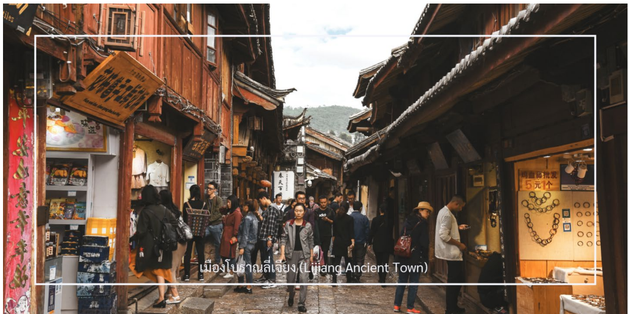
เมืองโบราณลี่เจียง (Lijiang Ancient Town)

เที่ยวชม สระมังกรดำ (Black Dragon Pool) ตั้งอยู่ใกล้กับเมืองลี่เจียง สระมังกรดำมีทิวทัศน์ที่งดงาม โดยมีภูเขาหิมะอยู่ ในพื้นที่หลังและน้ำที่ใสสะอาด นักท่องเที่ยวสามารถเดินเล่นรอบๆ สระ ถ่ายรูป และสัมผัสกับบรรยากาศที่เงียบสงบ นอกจากนี้ยังมีเส้นทางเดินป่าที่นำไปสู่จุดชมวิวที่สวยงาม บริเวณสระมีการสร้างอาคารและสะพานที่มีสถาปัตยกรรมแบบ ดั้งเดิม เช่น สะพานหินและศาลา ซึ่งทำให้ที่นี่มีความสวยงามและเป็นเอกลักษณ์ เที่ยวชม เมืองโบราณลี่เจียง (Lijiang Ancient Town) เป็นหนึ่งในเมืองโบราณที่มีชื่อเสียงและได้รับการขึ้นทะเบียนเป็นมรดกโลกจากองค์การยูเนสโกในปี 1997 ตั้งอยู่ในมณฑลยูนนาน ประเทศจีน เมืองนี้มีความสำคัญทั้งในด้านประวัติศาสตร์และวัฒนธรรม เมืองโบราณลี่เจียงมี สถาปัตยกรรมที่สวยงามและเป็นเอกลักษณ์ โดยมีบ้านเรือนที่สร้างขึ้นในสไตล์ดั้งเดิมของชาวหน่าซี (Naxi) ซึ่งมีการตกแต่ง ที่ละเอียดอ่อนและสวยงาม มีคลองและสะพานที่สวยงาม ซึ่งสร้างบรรยากาศที่เงียบสงบและโรแมนติก นักท่องเที่ยว สามารถเดินเล่นริมคลองและถ่ายรูปได้ มีตลาดที่ขายสินค้าท้องถิ่น เช่น เครื่องประดับแบบดั้งเดิม อาหารพื้นเมือง และของ ที่ระลึก นักท่องเที่ยวสามารถเลือกซื้อของที่ระลึกและสัมผัสกับบรรยากาศของตลาด