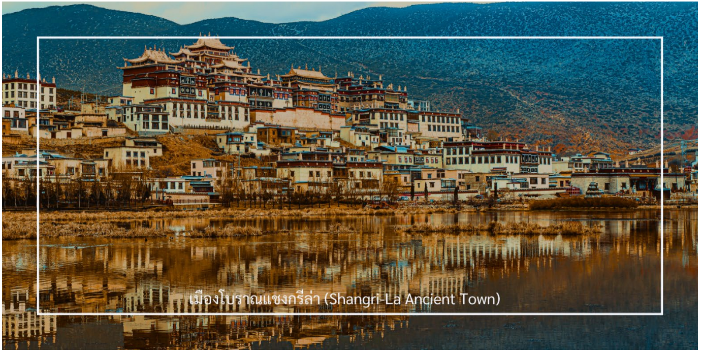
เมืองโบราณแชงกรีล่า (Shangri-La Ancient Town)

นำท่านชม พิพิธภัณฑ์จามรี แชงกรีล่า (Yak Museum, Shangri-La) เป็นสถานที่รวบรวมเรื่องราวและความรู้เกี่ยวกับจามรี (Yak) สัตว์คู่ใจของชาวทิเบต ที่มีบทบาทสำคัญทั้งด้านการเกษตร การขนส่ง และวัฒนธรรมประเพณีของชนพื้นเมือง ภายในพิพิธภัณฑ์มีการจัดแสดงทั้งโครงกระดูก จามรีจำลอง ภาพถ่าย และเครื่องมือเครื่องใช้ต่างๆ ที่แสดงให้เห็นถึงชีวิตประจำวันและความผูกพันระหว่างชาวทิเบตกับจามรี นอกจากนี้ยังมีการจัดกิจกรรมและนิทรรศการให้ผู้มาเยือนได้เรียนรู้วิถีชีวิตท้องถิ่นอย่างใกล้ชิด จากนั้น นำท่านเที่ยวชม เมืองโบราณแชงกรีล่า (Shangri-La Ancient Town) เป็นสถานที่ท่องเที่ยวที่โดดเด่นในเมืองแชงกรีล่า ซึ่งตั้งอยู่ในมณฑลยูนนาน ประเทศจีน เมืองโบราณนี้มีความสำคัญทั้งในด้านประวัติศาสตร์และวัฒนธรรม เมืองโบราณมีบ้านเรือนที่สร้างขึ้นในสไตล์ทิเบตและชาวหนาน ซึ่งมีการตกแต่งที่สวยงามและมีเอกลักษณ์เฉพาะตัว เป็นศูนย์กลางวัฒนธรรมของชาวทิเบต มีตลาดที่ขายสินค้าท้องถิ่น เช่น เครื่องประดับแบบทิเบต ผ้าทอมือ และอาหารพื้นเมือง นักท่องเที่ยวสามารถเลือกซื้อ