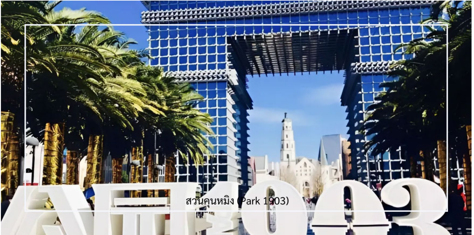
สวนคุณหมิง (Park 1903)

ประเทศจีน นอกจากความวิจิตรของตัวตึกแล้ว บริเวณโดยรอบยังโอบล้อมด้วยสวนเขียวขจี ต้นสนเก่าแก่ และทิวทัศน์บนเนินเขาที่เขียวสงบ นักท่องเที่ยวสามารถเดินชมความงามของศิลปกรรมจีนโบราณ จากนั้นนำท่าน ชมสวนคุณหมิง (Park 1903) เป็นสวนสาธารณะ เหมาะสำหรับการพักผ่อนและเพลิดเพลินกับธรรมชาติ สวนแห่งนี้มีพื้นที่กว้างขวาง มีเส้นทางเดินเล่น สนามหญ้า และพื้นที่สำหรับกิจกรรมต่างๆ นอกจากนี้ยังมีต้นไม้และดอกไม้ที่หลากหลาย ทำให้สวนมีบรรยากาศสดชื่นและสงบเงียบ