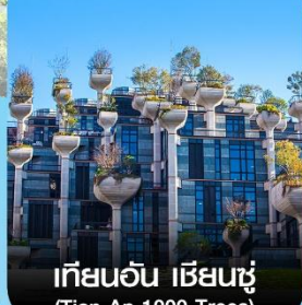
เทียนอัน เซียนซู่ (Tian An 1000 Trees)