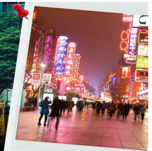
ถนนนานจิง Nanjinglu Street POP MART

ค่า ! รับประทานอาหารค่ำ ณ ภัตตาคาร (6) เมนูพิเศษ!! บุปเฟต์ + ซีฟู้ด พักที่ (เมืองเซี่ยงไฮ้) HARBOUR PLAZA METROPOLITAN SHANGHAI HOTEL หรือเทียบเท่า ระดับ 5 ดาว