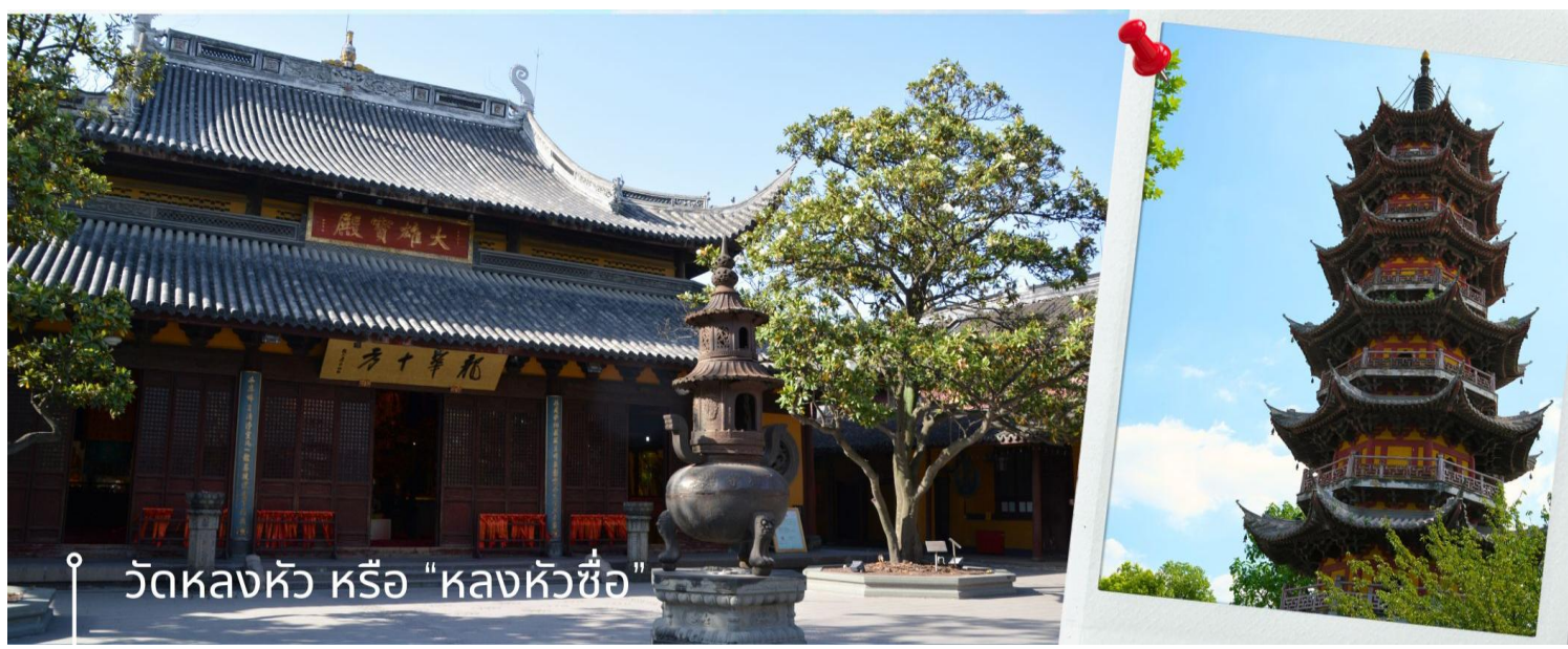
วัดหลงหัว หรือ “หลงหัวซื่อ”

หลังรับประทานอาหารเช้า นำท่านเดินทางสู่ วัดหลงหัว หรือ “หลงหัวซื่อ” เป็นวัดโบราณที่อยู่คู่บ้านคู่มืองของมหานครเซี่ยงไฮ้มานาน เป็นหนึ่งในวัดที่เก่าแก่ที่สุดเซี่ยงไฮ้ ซึ่งปัจจุบันมีอายุเก่าแก่มากกว่า 1,700 ปี นอกจากนี้ยังเป็นวัดที่มีขนาดใหญ่ที่สุดเซี่ยงไฮ้อีกด้วย วัดที่เราเห็นกันในปัจจุบัน เป็นวัดที่สร้างขึ้นใหม่ในช่วงของจักรพรรดิถังซวี่แห่งราชวงศ์ซ่ง ซึ่งสร้างขึ้นตามแบบฉบับสถาปัตยกรรมของราชวงศ์ซ่ง อาคารสิ่งก่อสร้างต่างๆ ที่เห็นในปัจจุบัน ส่วนใหญ่จึงเป็นรูปแบบสถาปัตยกรรมแบบวัดพุทธนิกายมหายานในยุคของราชวงศ์ซ่ง ภายในมีวิหารหลายหลัง ซึ่งแต่ละหลังมีรูปปั้นของพระพุทธรูปที่มีประติมากรรมสวยงามประดิษฐานอยู่ เช่น องค์เจ้าแม่กวนอิมพันมือ, พระสังกัจจายน์ ให้ท่านได้หัวสັกการะและชื่นชมความงาม