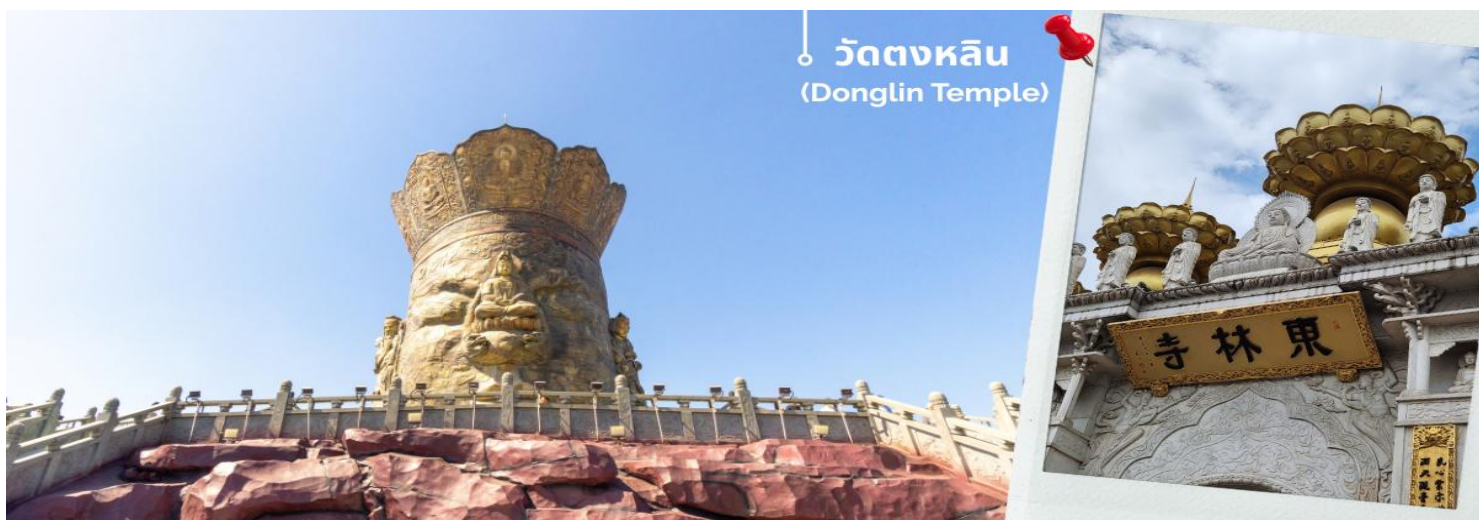
วัดตงหลิน (Donglin Temple)

จากนั้นนำท่านเข้าเมืองเซี่ยงไฮ้ นำท่านไหว้พระขอพรที่ วัดตงหลิน (Donglin Temple) ป็นวัดพุทธเก่าแก่ที่ก่อตั้งมาตั้งแต่ปี ค.ศ. 1308 สมัยราชวงศ์หยวน เคยถูกทำลายหลายครั้งและบูรณะใหญ่ระหว่างปี 2004-2007 จนกลายเป็นวัดขนาดใหญ่และสวยงามมาก จุดเด่นของวัดคือพระกวนอิมพันมือสูง 27 เมตรซึ่งถือเป็นพระในร่มที่สูงที่สุดในโลก ประตูลงสัมฤทธิ์สูงราว 20 เมตรที่จารึกพระพุทธรูป 999 องค์ อีกด้วย ยังถือว่าเป็นวัดที่สงบเพราะนักท่องเที่ยวยังไม่เยอะนัก