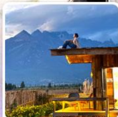
ร้านค้าเฟยฮุนต้ออัน