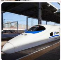
รถไฟความเร็วสูง