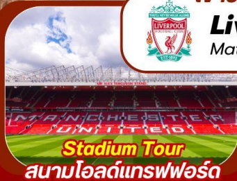
Stadium Tour สนามโอลด์แทรฟฟอร์ด