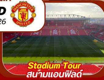
Stadium Tour สนามแอนฟิลด์

ชมฟุตบอลติดขอบสนาม ที่นั่ง Longside Lower การ์นต์ 2 ที่นั่งติดกัน