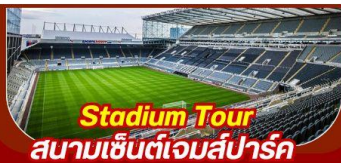
Stadium Tour สนามเชลซี