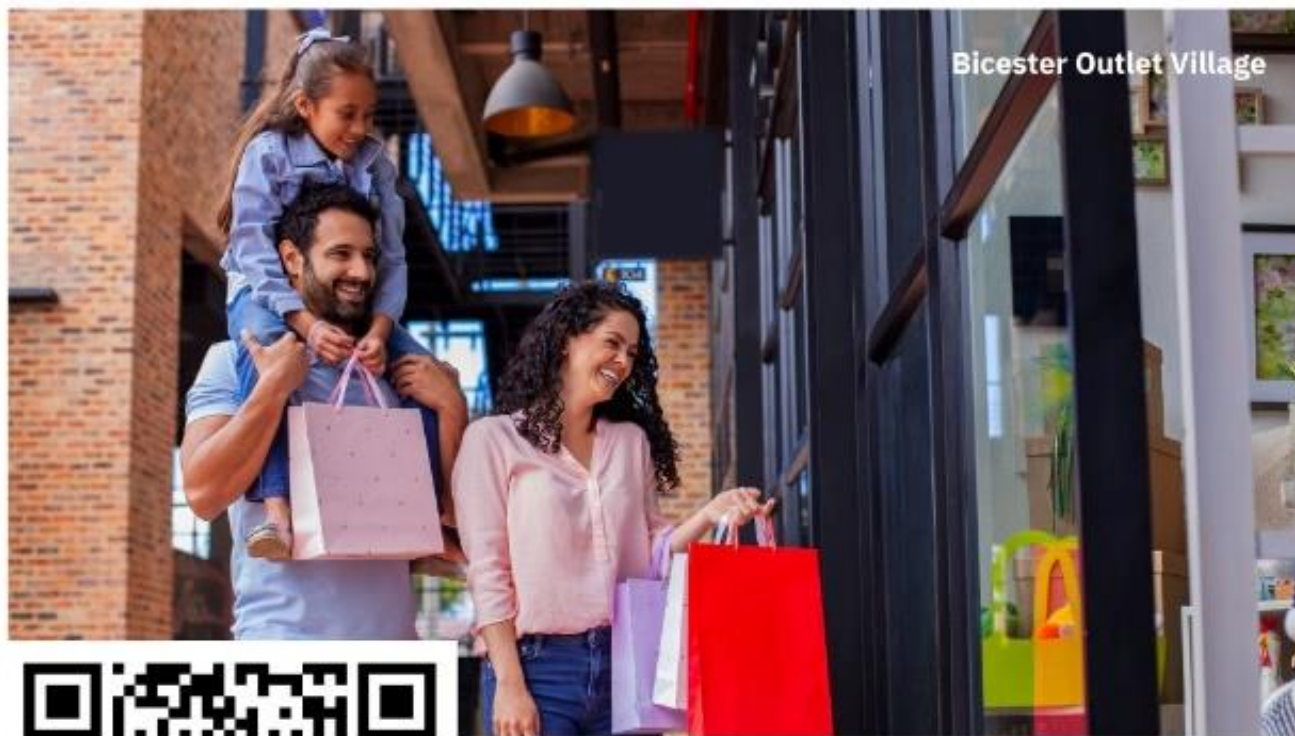
Bicester Outlet Village