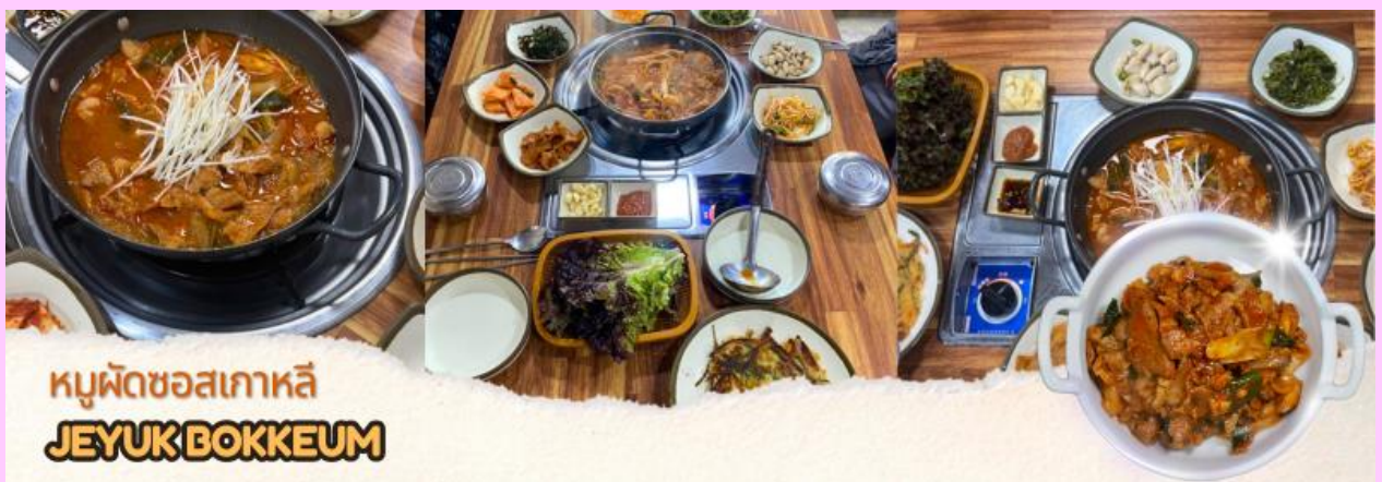
หมูผัดซอสเกาหลี JEYUK BOKKEUM

เที่ยง ☺️ รับประทานอาหารเที่ยง (มื้อที่ 1) แจกบู๊ท็อกกิม หรือหมูผัดซอสเกาหลี เป็นอาหารที่คนเกาหลีนิยมทานพอๆ กับเมนูยอดฮิตอย่างบูลโกกกี รสชาติเผ็ดนิดๆหวานหน่อยๆ รับประทานคู่กับข้าวสวยร้อนๆ หรือวางหมูลงบนผักสด พร้อมด้วยเครื่องเคียงต่างๆ หรือสามารถห่อเป็นคำรับประทานได้ตามใจชอบ