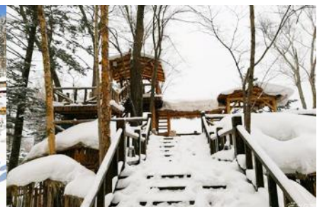
ระเบียงชมวิวปีงอูยซาน