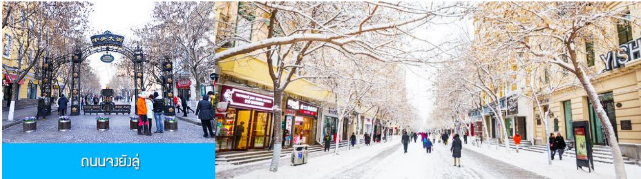
ถนนมายัง

หลังอาหารนำท่านชม อนุสาวรีย์ฝงหง 防洪纪念碑 อนุสรณ์ของชาวเมืองฮาร์บินที่ถูกจารึกในประวัติศาสตร์ในการเอาชนะอุทกภัยธรรมชาติครั้งใหญ่ในปี ค.ศ. 1957