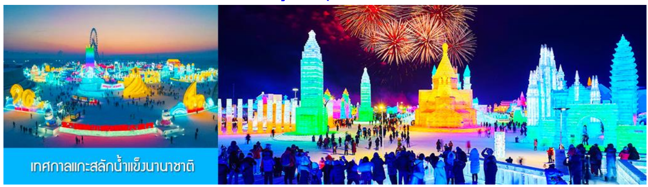
เทศกาลแกะสลักน้ำแข็งนานาชาติ

รับประทานอาหารค่ำ ณ ภัตตาคาร *เมนูพิเศษ สุกี้+ปิ้งย่าง (3)