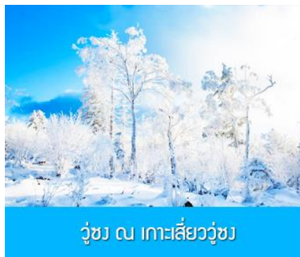
วู่ซง ณ เกาะลี้วู่ซง

พักที่ JILIN LUNWEIKE HOTEL โรงแรมระดับ 4 ดาวท้องถิ่นหรือเทียบเท่า ในเมืองจีหลิน