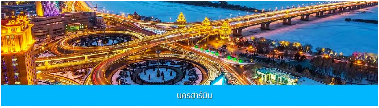
นครฮาร์บิน