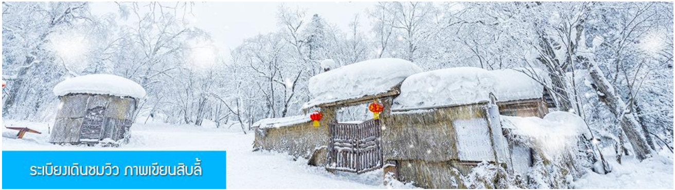
ระเบียบเดินชมวิว ภาพเขียนสลิ

รายการที่ 1 เที่ยวชมระเบียบชมวิวภาพเขียนสลิ 冰雪十里画廊 เป็นการเดินชมวิวธรรมชาติตามเนินเขาท่ามกลางแนวป่าที่มีต้นไม้ที่มีน้ำแข็งเกาะอยู่ตามกิ่งไม้ ภูเขาทั้งลูกถูกห่อหุ้มด้วยหิมะขาวฟู เป็นภาพวิวธรรมชาติฤดูหนาวที่สวยงามน่าประทับใจและพบได้เฉพาะในฤดูหนาวทางภาคอีสานของจีนเท่านั้น เวลาที่ใช้สำหรับโปรแกรมเสริมนี้ประมาณ 1 ชั่วโมงครึ่ง อัตราค่าบริการ ท่านละ 280 หยวน หรือ 1400 บาท อัตรานี้รวมค่าบัตรผ่านเข้าอุทยาน ค่ารถรับ ส่ง และค่าบริการของไกด์ท้องถิ่น และค่าบริการจัดการของบริษัททัวร์ท้องถิ่น หมายเหตุ โปรแกรมเสริมเป็นโปรแกรมที่ท่านต้องเสียค่าใช้จ่ายเองด้วยความสมัครใจ สำหรับท่านที่ไม่เข้าร่วมกิจกรรมดังกล่าวสามารถนั่งพักที่ศูนย์บริการนักท่องเที่ยวได้