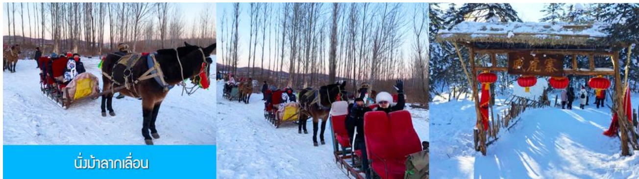
นั่งม้าลากเลื่อน

โดดเด่นด้วยสถาปัตยกรรมแบบตะวันตก ให้ท่านเก็บภาพบรรยากาศความสวยงามของสถานีรถไฟที่ปัจจุบันยังคงเปิดให้บริการอยู่