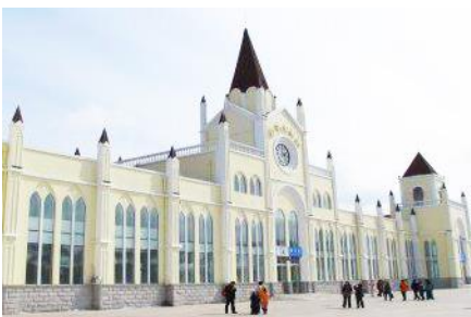
สภานิรภพยาบูลี

หมายเหตุ เพื่อความสะดวกในการเข้าพักใน HOME STAY ภายในหมู่บ้านหิมะ ทางทัวร์แนะนำให้ท่านจัดเตรียม เสื้อผ้าและเครื่องใช้เท่าที่จำเป็น 1 ชุดใส่กระเป๋าใบเล็กหรือเป้แบบสะพายได้ เพื่อสะดวกในการนำติดตัวไปใช้ สำหรับคืนที่นอนในหมู่บ้านหิมะ หากนำกระเป๋าเดินทางใบใหญ่เข้าสู่ที่พักในหมู่บ้านอาจสร้างความไม่สะดวกแก่ ท่าน จึงไม่แนะนำ