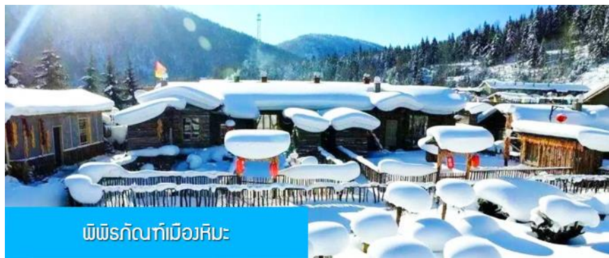
พิพิธภัณฑ์เมืองหิมะ

หมายเหตุ การไปพักในหมู่บ้านหิมะทางทัวร์ไม่สามารถจัดรถทัวร์ไปส่งลูกทัวร์ถึงหน้าโฮมสเตย์ได้ ใกล้เคียงจะนำคณะขึ้นรถ Shuttle Bus ของอุทยานเข้าไปยังหมู่บ้านหิมะ โดยลูกทัวร์ต้องถือหรือลากกระเป๋าเข้าที่พักด้วยตัวเอง เพราะโฮมสเตย์จะไม่มีพนักงานยกกระเป๋ามาคอยบริการยกกระเป๋าให้ผู้เข้าพัก ท่านควรจัดเตรียมกระเป๋าใบเล็กที่บรรจุเสื้อผ้า และเครื่องใช้จำเป็นสำหรับการพักผ่อน ณ โฮมสเตย์ในเมืองหิมะในคืนนี้ เพื่อสะดวกต่อการเคลื่อนย้ายกระเป๋า ภายในโฮมสเตย์จะมีสบู่น้ำหอม แชมพูภายในห้องน้ำ แปรงลิ้นฟันทึบ แต่จะไม่มีหมวกคลุมผมสำหรับสุภาพสตรี ควรเตรียมไปด้วย