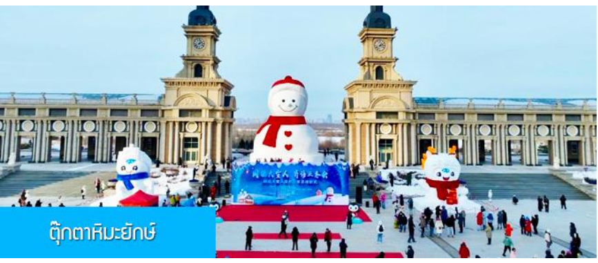
ตุ๊กตาหิมะยักษ์