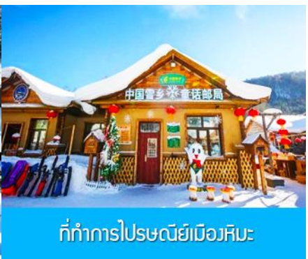
ที่ทำการไปรษณีย์เมืองหิมะ

วันที่สี่ พิพิธภัณฑ์เมืองหิมะ –ที่ทำการไปรษณีย์เมืองหิมะ– ไถ่ให้นำเสนอ ออฟชั่นภาพเขียนสีบลิ้ และ SNOW MOBILE เดินทางสู่เมืองจีหลิน-ชมไนท์วิวภูเขาหลงถานซาน