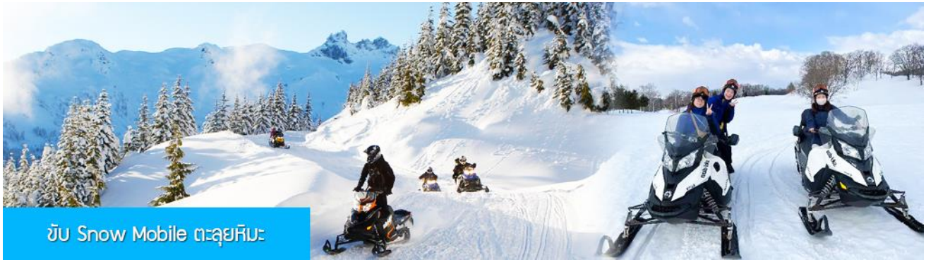
ขับ Snow Mobile ตะลุยหิมะ

รับประทานอาหารกลางวัน ณ ภัตตาคาร (8) ไกด์ท้องถิ่นนำเสนอโปรแกรมเสริม หรือ OPTIONAL TOUR ให้ท่านเลือกตามความสมัครใจ