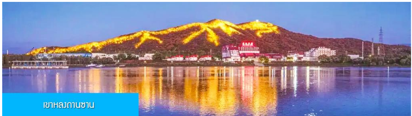
เขาลงถานซาน

หลังอาหารนำท่านผ่านชม วิวยามค่ำของเขา หลงถานซาน 龙潭山夜景 (ผ่านชมระยะไกล) ภูเขารูปทรงคล้ายมังกรในช่วงกลางคืนภูเขาจะถูกประดับด้วยแสงไฟที่สามารถมองเห็นแต่ไกล คล้ายรูปมังกร (บางคนมองว่าคล้ายรูปไดโนเสาร์) จากนั้นนำท่านเดินทางเข้าที่พัก