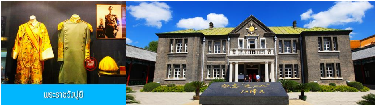
พระราชวังบูยี่

หลังอาหารนำท่านเช็คเอาท์ออกจากโรงแรมที่พักแล้วเดินทางสู่ เมืองฉางชุน 长春市 (ระยะทาง 120 กม. ใช้เวลาเดินทางราว 1 ชั่วโมงครึ่ง)