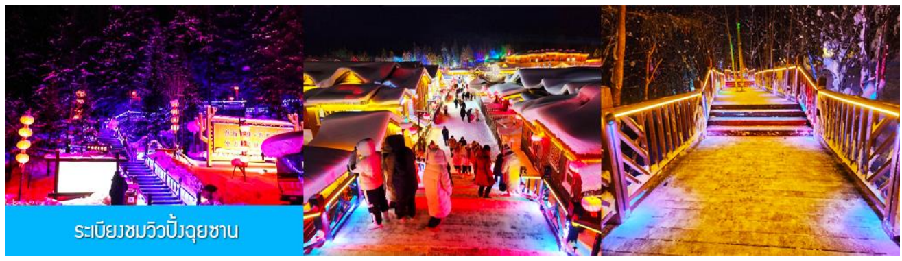
ระเบียงชมวิวยิ่งจฺยชาน

เมื่อเดินทางถึงหมู่บ้านหิมะ นำท่านเปลี่ยนมาใช้รถบัสของอุทยานเดินทางเข้าหมู่บ้าน เนื่องจากรถบัสส่วนตัวจะไม่สามารถเข้าไปในหมู่บ้านได้ นำท่านเช็คอินเข้าที่พักเรียบร้อยแล้ว