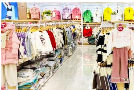
ศูนย์จำหน่ายอุปกรณ์กันหนาว

เมืองฮาร์บิน 哈尔滨市 ตั้งอยู่ทางตอนเหนือของจีน เป็นเมืองเอกของมณฑลเฮยหลงเจียง มีสมญานามว่าเป็นนครแห่งฤดูหนาว และกรุงมอสโกตะวันออก อีกทั้งยังได้ชื่อว่าเป็นเมืองหลวงแห่งฤดูหนาวเนื่องจากเมืองแห่งนี้มีช่วงฤดูหนาวยาวกว่าฤดูร้อน และมีเทศกาลแกะสลักน้ำแข็งนานาชาติจัดขึ้นที่เมืองนี้ในช่วงฤดูหนาวของทุกปี เป็นจุดหมายปลายทางสำหรับนักท่องเที่ยวทั้งในและต่างประเทศที่ชื่นชอบเพราะที่นี่ทุกสิ่งอย่างจะถูกห่อหุ้มด้วยหิมะพักที่ HARBIN WINTER INN HOTEL โรงแรมระดับ 4 ดาวท้องถิ่น ในเมืองเมืองฮาร์บิน