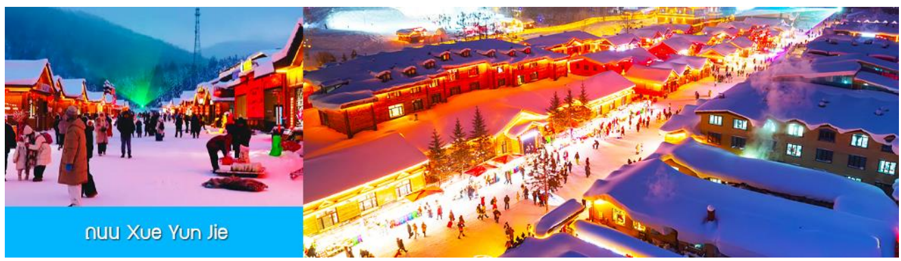
ถนน Xue Yun Jie

รับประทานอาหารค่ำ ณ ร้านอาหารพื้นเมืองในเมืองหิมะ (6)