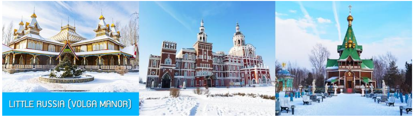
LITTLE RUSSIA (VOLGA MANOR)

จากนั้นนำท่านเที่ยวชม สวน LITTLE RUSSIA (VOLGA MANOR) 伏尔加庄园 สวนพฤกษศาสตร์ที่ออกแบบคล้ายพระราชวังสไตล์รัสเซียในยุคกลาง บนเนื้อที่กว่า 600,000 ตารางเมตร แหล่งท่องเที่ยวระดับ 4A และเป็นศูนย์แลกเปลี่ยนทางวัฒนธรรมจีนและรัสเซีย อาคารทุกหลังภายในสวนแห่งนี้ล้วนถูกออกแบบอย่างปราณีตโดยสถาปนิกชาวรัสเซีย ประกอบด้วยอาคารและ คฤหาสน์หรัสไตล์รัสเซีย ที่โดดเด่นด้วยเอกลักษณ์ อาทิ วิหาร โรงแรม ภัตตาคาร พิพิธภัณฑ์ศิลปะ โบสถ์คริสต์ต่อโรดดอกซ์ โรงเหล้าอดก้า ฯลฯ ที่แวดล้อมด้วยต้นไม้สวนหย่อม ธารน้ำ สะพานไม้ เป็นแหล่งท่องเที่ยวสไตล์รัสเซียที่มีมุมเก็บภาพและจุดเช็คอินเก๋ไก๋มากที่สุดในเมืองฮาร์บิน. ให้ท่านเดินเล่น และเก็บภาพตามมุมสวยในสวนที่เปลี่ยนไปเป็นลานหิมะ สวยงามแปลกตา