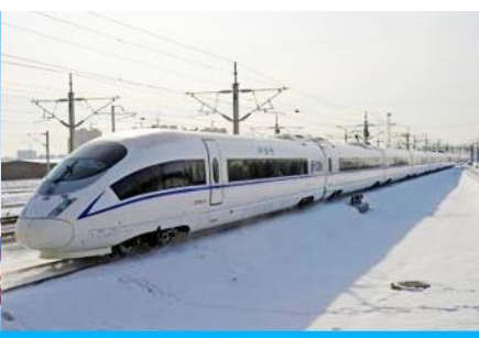
รถไฟความเร็วสูง