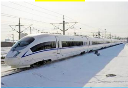
รถไฟความเร็วสูง

หมายเหตุ เพื่อความสะดวกในการเข้าพักใน HOME STAY ภายในหมู่บ้านหิมะ ทางทัวร์แนะนำให้ท่านจัดเตรียมเสื้อผ้าและเครื่องใช้เท่าที่จำเป็น 2 ชุดใส่กระเป๋าใบเล็กหรือเป้แบบสพายได้ เพื่อสะดวกในการนำติดตัวไปใช้สำหรับคืนที่นอนในหมู่บ้านหิมะ เนื่องการนำกระเป๋าเดินทางใบใหญ่เข้าสู่ที่พักในหมู่บ้านอาจสร้างความไม่สะดวกแก่ท่าน