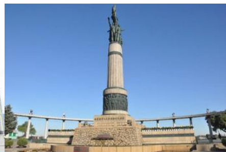
อนุสาวรีย์ฝิงหว