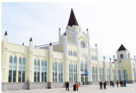
สถานีรถไฟยาบูลี