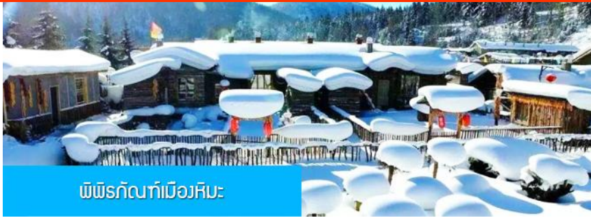
พืชรักบี้ที่เมืองหิมะ