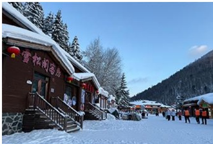
XUE XIANG HOMESTAY