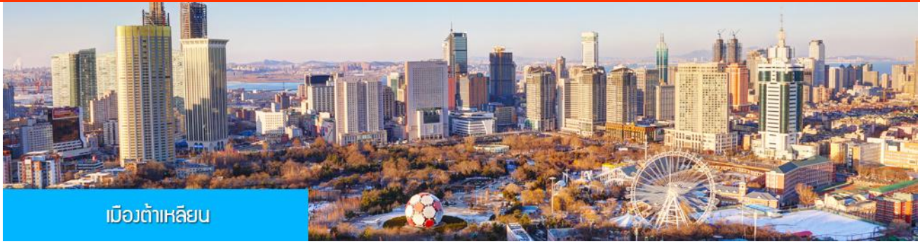
เมืองต้าเหลียน