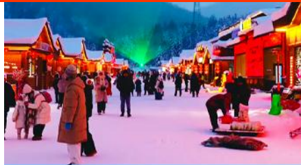
ถนน Xue Yun Jie