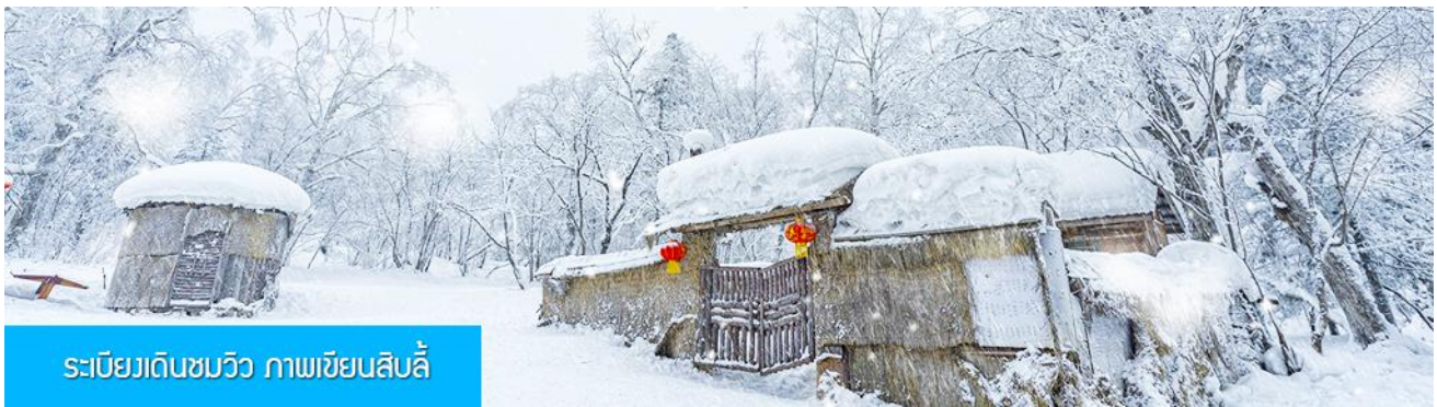
ระเบียบเดินชมวิว ภาพเขียนสลับ

หลังอาหารให้ท่านพักผ่อนตามอัธยาศัยใน โสมสเคย์ หรือเดินเล่น ถ่ายรูปตามอัธยาศัยภายในหมู่บ้านหิมะ ไกด์ท้องถิ่นนำเสนอโปรแกรมเสริม หรือ OPTIONAL TOUR ให้ท่านเลือกตามความสมัครใจ