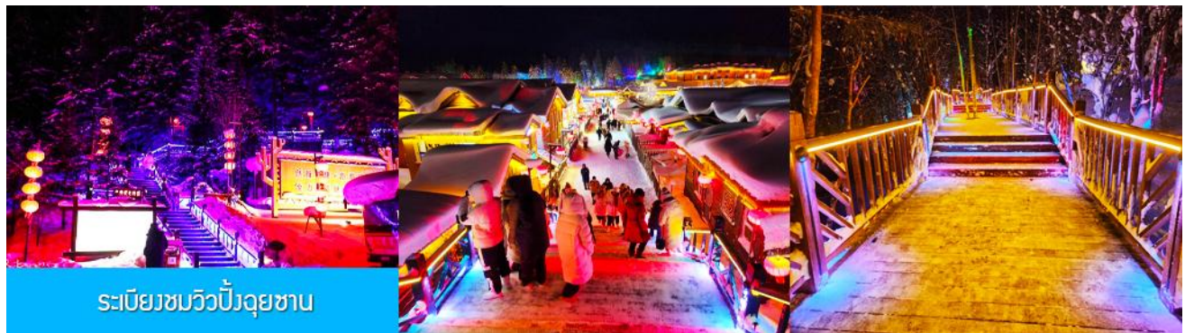
ระเบียบชมวิวป่าหิมะ