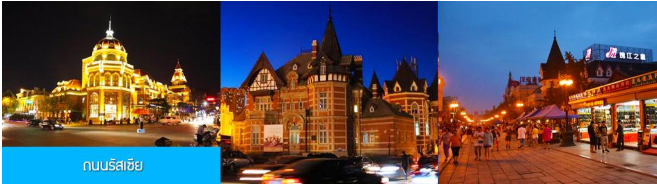
ถนนรัสเซีย

ท่านสามารถเที่ยวชม ถนนรัสเซีย 俄罗斯风情街 ชมอาคารสถาปัตยกรรมตะวันตก (รัสเซีย) และร้านค้าที่จำหน่ายสินค้าและของที่ระลึกที่น่าเข้าจากรัสเซียได้ ณ ถนนคนเดิน (ถนนรัสเซีย) ที่อยู่ด้านหลังโรงแรมที่พัก