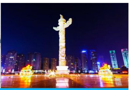
จัตุรัสซิวไห่

วันที่ห้า เมืองฮาร์บิน-โบสถ์เซนต์โซเฟีย- รถไฟความเร็วสูงสู่เมืองต้าเหลียน – ถนนรัสเซีย