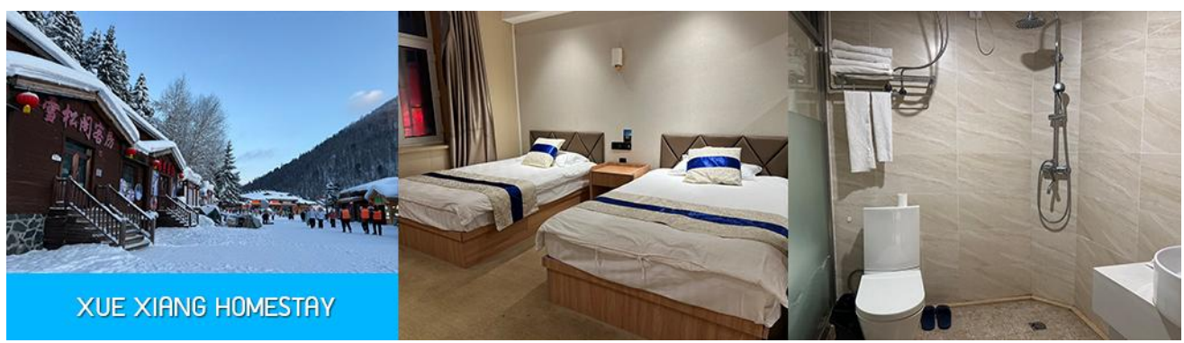
XUE XIANG HOMESTAY

พักที่ XUE XIANG HOMESTAY ในหมู่บ้านหิมะที่พักเดิม