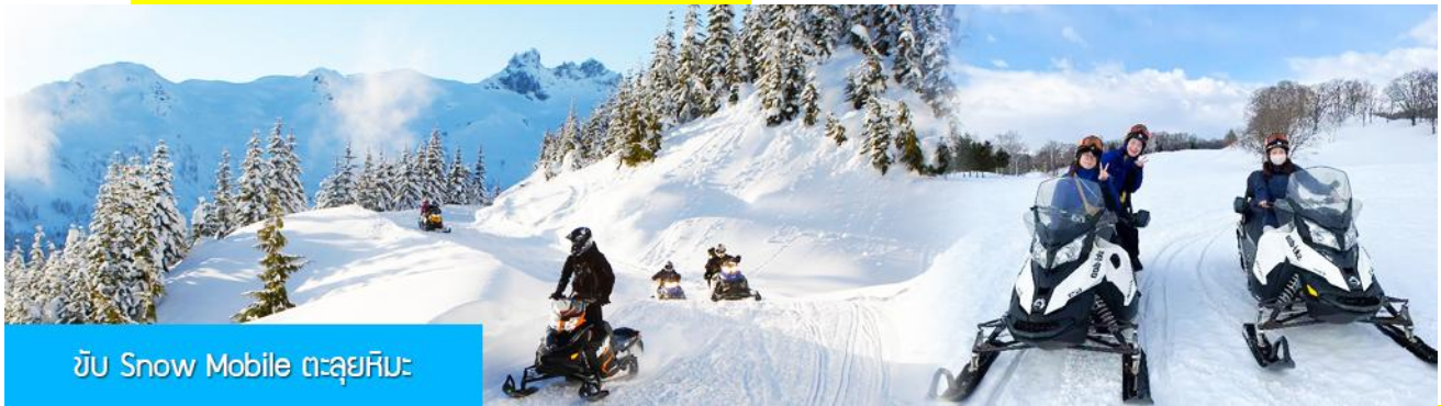
ขับ Snow Mobile ตะลุยหิมะ

รายการที่ 1 เทียวชมระเบียบชมวิวภาพเขียนสลับ 冰雪十里画廊 เป็นการเดินชมวิวธรรมชาติตามเนินเขาท่ามกลางแนวป่าที่มีต้นไม้ที่มีน้ำแข็งเกาะอยู่ตามกิ่งไม้ ภูเขาทั้งลูกถูกห่อหุ้มด้วยหิมะขาวฟู เป็นภาพวิวธรรมชาติที่สวยงามน่าประทับใจและพบได้เฉพาะในฤดูหนาวทางภาคอีสานของจีนเท่านั้น เวลาที่ใช้สำหรับโปรแกรมเสริมนี้ประมาณ 1 ชั่วโมงครึ่ง อัตราค่าบริการ ท่านละ 280 หยวน หรือ 1400 บาท อัตรานี้รวมค่าบัตรผ่านเข้าอุทยาน ค่ารถรับ ส่ง และค่าบริการของไกด์ท้องถิ่น และค่าบริการจัดการของบริษัททัวร์ท้องถิ่น หมายเหตุ โปรแกรมเสริมเป็นโปรแกรมที่ท่านต้องเสียค่าใช้จ่ายเองด้วยความสมัครใจ สำหรับท่านที่ไม่เข้าร่วมกิจกรรมดังกล่าวสามารถนั่งพักที่ศูนย์บริการนักท่องเที่ยวได้