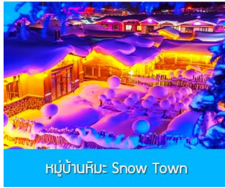
หมู่บ้านหิมะ Snow Town

เช้า รับประทานอาหารเช้า ณ ห้องอาหารของโรงแรม (4) หลังอาหารนำท่านเดินทางสู่สถานีรถไฟความเร็วสูงเมืองฉ่าเหลียน 08.00 น. นำท่านขึ้นรถไฟความเร็วสูงขบวนที่ G047 (08.00/11.37) เพื่อเดินทางไปยังเมืองฮาร์บิ้น **บริการขนกระเป๋าสัมภาระขึ้นขบวนรถไฟให้ท่านละ 1 ใบ 11.37 น. นำท่านเดินทางถึงสถานีรถไฟเมืองฮาร์บิ้น นำท่านเดินทางโดยรถบัสปรับอากาศสู่ตัวเมืองฮาร์บิ้น เมืองฮาร์บิ้นตั้งอยู่ทางตอนเหนือของจีน เป็นเมืองเอกของมณฑลเฮยหลงเจียง มีสมญานามว่าเป็นนครแห่งฤดูหนาว และกรุงมอส โคตตะวันออก อีกทั้งยังได้ชื่อว่าเป็นเมืองหลวงแห่งฤดูหนาวเนื่องจากเมืองแห่งนี้มีช่วงฤดูหนาวยาวกว่าฤดูร้อน และมีเทศกาลแกะสลักน้ำแข็งนานาชาติจัดขึ้นที่เมืองนี้ในช่วงฤดูหนาวของทุกปี เป็นจุดหมายปลายทางสำหรับนักท่องเที่ยวทั้งในและต่างประเทศที่ชื่นชอบเพราะที่นี่ทุกสิ่งอย่างจะถูกห่อหุ้มด้วยหิมะ เที่ยง รับประทานอาหารกลางวัน ณ ภัตตาคาร (5) นำท่านแวะร้านจำหน่ายอุปกรณ์กันหนาว (แอมป์ริถุนมือ ผ้าพันคอ และหมวกแบบธรรมชาติ) ท่านสามารถเลือกซื้ออุปกรณ์กันหนาวที่ใช้ในฤดูหนาวได้จากที่นี่