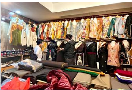
ศูนย์จำหน่ายอุปกรณ์กันหนาว