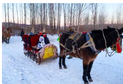
นั่งม้าลากเลื่อน