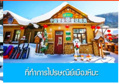
ที่ทำการไปรษณีย์เมืองหิมะ

วันที่สาม หมู่บ้านหิมะ-ไกด์นำเสนอโปรแกรมเสริม หรือ อิสระเดินเล่นในหมู่บ้านหิมะ -พิพิธภัณฑ์หมู่บ้านหิมะ - ที่ทำการไปรษณีย์หมู่บ้านหิมะ-ระเบียบชมวิวปังจฺยชาน