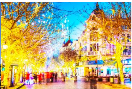
ถนนวียงลู่