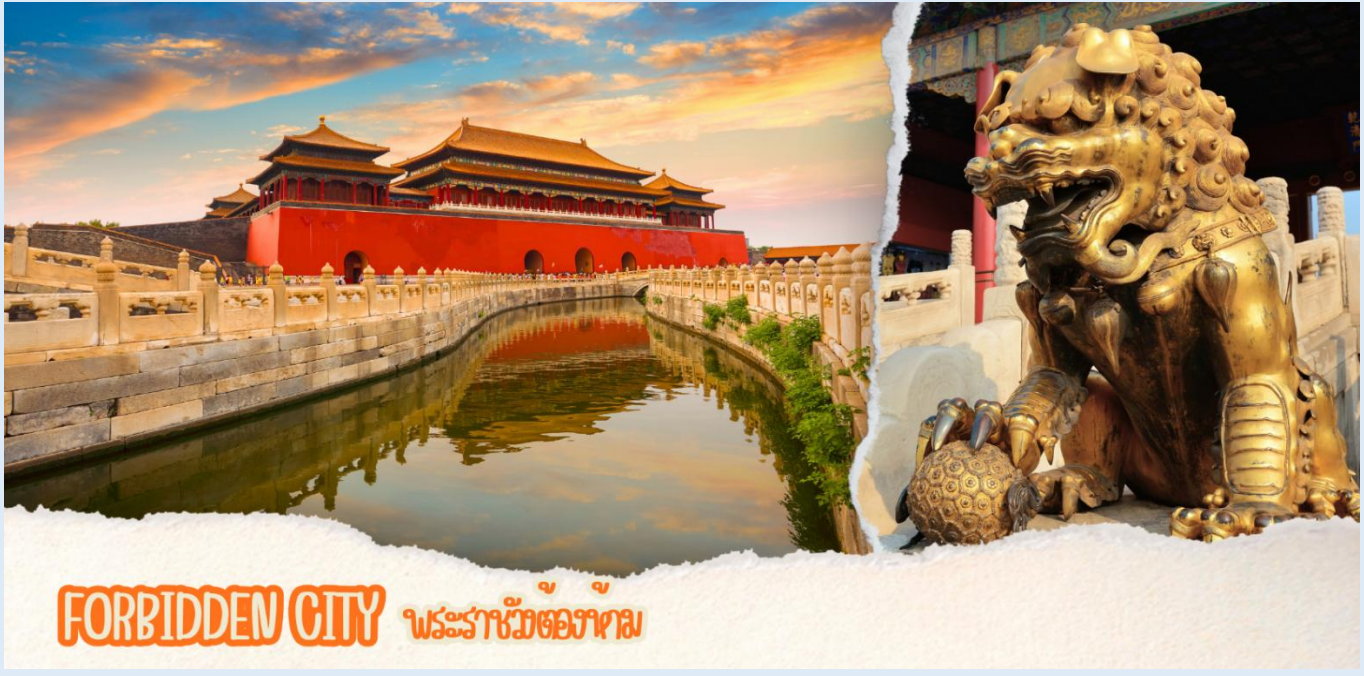
FORBIDDEN CITY พระราชวังต้องห้าม

จากนั้นนำท่านสู่ ถนนหวังฝูจิ่ง ถนนคนเดินสุดฮิตใจกลางกรุงปักกิ่งปัจจุบันถนนนี้เป็นที่นิยมมากในหมู่นักช้อปปิ้ง และนักท่องเที่ยวที่ตบเท้าเข้ามาเพื่อเสาะหาของลดราคาและเสื้อผ้าที่มีเอกลักษณ์ไม่ซ้ำใคร ถนนการค้าที่พลุกพล่านแห่งนี้มีร้าน บาร์ ร้านอาหาร และคาเฟ่เรียงรายตลอดทาง อยู่บนถนนคนเดินสายนี้ให้ท่านได้ช้อปปิ้ง ร้าน Pop Mart ที่ใหญ่ที่สุดในปักกิ่งตุ๊กตา blind box หน้าตาน่ารักที่ดังที่สุดในจีนตอนนี้ ต้องยกให้กับ Popmart นำท่านชม เมืองโบราณใต้ดิน อยู่ภายในห้างหวังฝูจิ่งเป็นเมืองปักกิ่งจำลองในช่วงทศวรรษที่ 1980 และ 1990 และยังมีสถานีรถไฟเก่า หัวรถจักรดีเซล Dongfeng เป็นรุ่นที่ใช้ในรถไฟของจีนรุ่นแรกที่ใช้ขับเคลื่อนด้วยไฟฟ้า