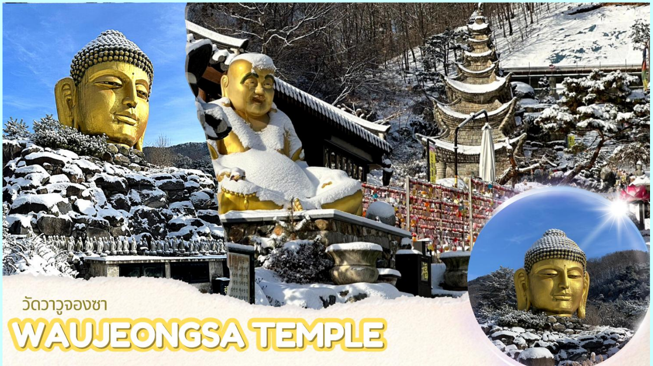
วัดวาจูองซา

นำท่านไป วัดวาจูองซา (Waujeongsa Temple) ตั้งอยู่ในเมืองยงอิน จังหวัดคยองกีโด เป็นวัดเก่าแก่ที่ตั้งอยู่ กลางภูเขา มีเศียรพระพุทธรูปเจ้าขนาดใหญ่สีทองอร่ามดูโดดเด่น ซึ่งเป็นสัญลักษณ์ที่สำคัญของวัดนี้ เศียร พระพุทธรูปนี้มีความสูงถึง 8 เมตร วางตั้งอยู่บนกองหินขนาดใหญ่ วัดแห่งนี้สร้างขึ้นในปี ค.ศ. 1970 โดย นักบวชแสด็อกเพื่อแสดงการตอบแทนความเมตตากรุณาของพระพุทธเจ้าในการรวมประเทศเกาหลีเหนือและ เกาหลีใต้