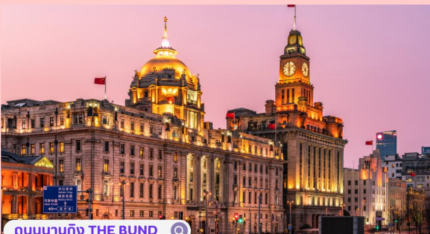
ถนนนาจิง THE BUND

ไฮ้ที่ตั้งอยู่ชั้น 3 จากนั้นนำ ท่านเดินทางกลับ เมืองเซี่ยงไฮ้ เมืองที่ใหญ่ที่สุดของจีน มีท่าเรือที่มีจำนวนเรือคับคั่งที่สุดในโลกและมีคนอาศัยอยู่อย่างหนาแน่นมากที่สุดในจีน ที่ผสมผสานความเป็นเมืองเก่าและเมืองใหม่ได้อย่างลงตัว นำท่านสู่บริเวณ หาดไวทาน (WAITAN) ซึ่งไม่ได้เป็นหาดทรายชายทะเลแต่อย่างใด แต่เป็นย่านถนนริมแม่น้ำที่มีความยาว