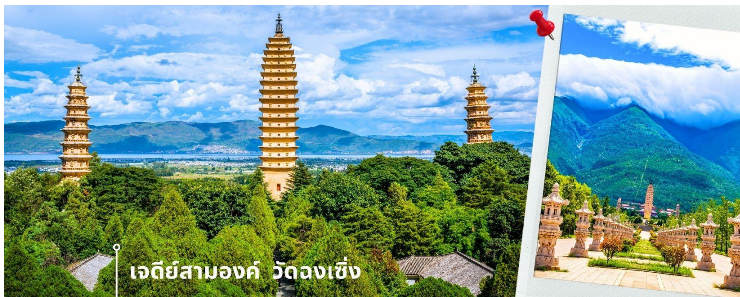
เจดีย์สามองค์ วัดจงเซิ่ง