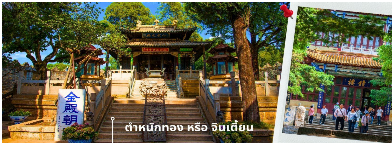
ตำหนักทอง หรือ จินเตี้ยน

นำท่านเยี่ยมชม ตำนานทอง หรือ จินเตี้ยน (The Golden Temple Park | Jindian park) (รวมค่ารถราง) โบราณสถานสำคัญของมณฑลยูนนาน ที่ได้รับการปกป้องดูแลโดยรัฐบาลจีน ตั้งอยู่บริเวณเชิงเขาหมิงเฟิง ล้อมรอบด้วยแนวกำแพงและหอคอยเหมือนเป็นป้อมปราการ ตำนานทองถูกเรียกตามลักษณะอาคารที่มีสีทองอร่าม จากทองเหลืองในส่วนของผนังและหลังคา รวมกว่า 200 ตัน โดยถือเป็นสิ่งปลูกสร้างสัมฤทธิ์ที่ใหญ่ที่สุดของจีน ภายในมีรูปปั้นทองโดยมีเงินอยู่ (เสวียนอู่) เทพเจ้าลัทธิเต๋าเป็นองค์ประธาน