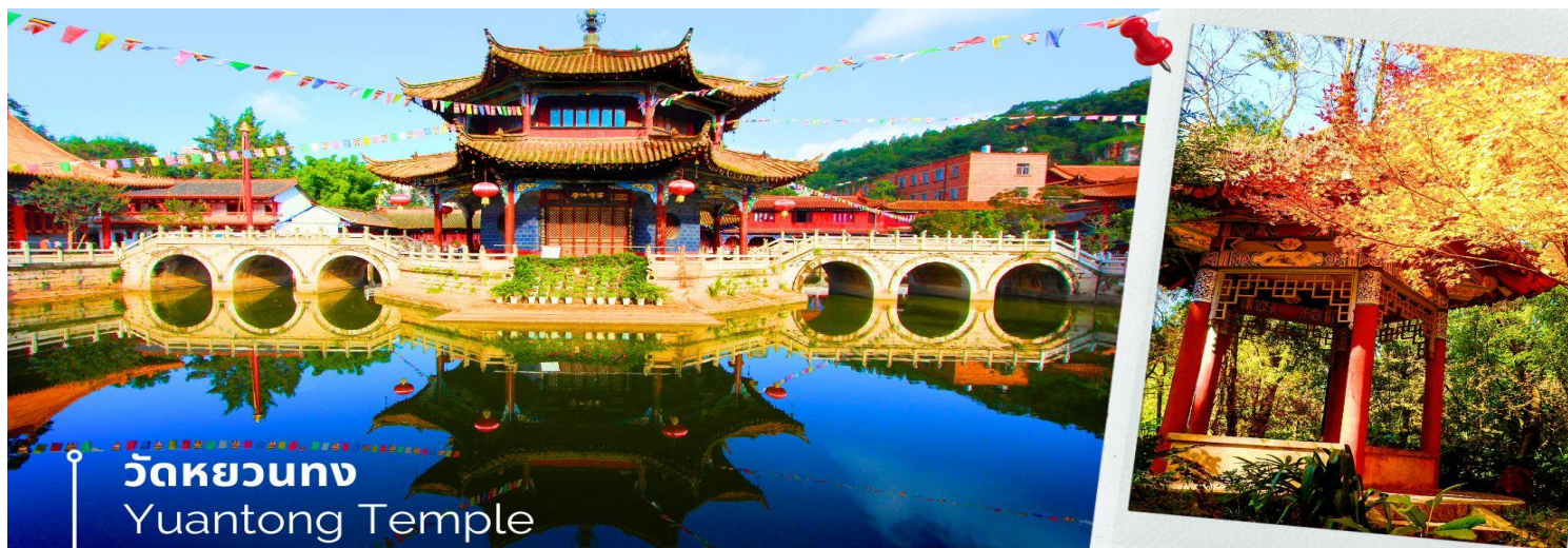
วัดหยวนตง Yuantong Temple

นำท่านชม วัดหยวนตง (Yuantong Temple) วัดแห่งนี้เป็นวัดที่ใหญ่และเก่าแก่ที่สุดในเมืองคุนหมิง สร้างมาตั้งแต่สมัยราชวงศ์ถัง มีอายุยาวนานประมาณ 1,200 กว่าปี การสร้างวัดแห่งนี้จะแปลกตากว่าวัดอื่นในจีน เพราะปกติแล้วการสร้างวัดของจีนส่วนมากจะต้องสร้างอยู่บนภูเขา แต่วัดหยวนตงสร้างวัดต่ำกว่าภูเขา โดยวิหารจะอยู่ต่ำที่สุด เนื่องจากวัดแห่งนี้ไม่ได้สร้างขึ้นเพื่อเป็นวัดโดยตรง แต่เคยเป็นศาลเจ้าแม่กวนอิมมาก่อน