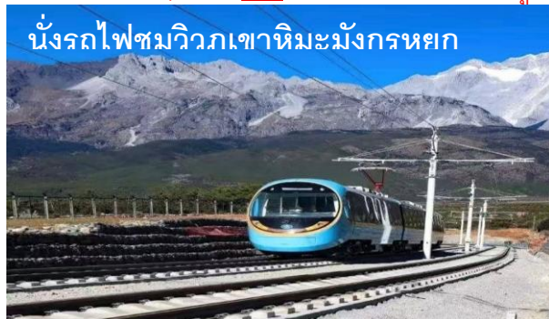
นั่งรถไฟชมวิวกภูเขาหิมะมังกรหยก

(ค่าทัวร์รวมเครื่องดื่มท่านละ 1แก้วมูลค่า 35หยวน**)