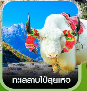
ทะเลสาบปีสุยเทอ