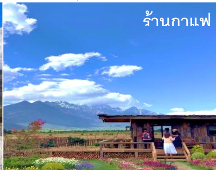
ร้านกาแฟ YUN DI'AN