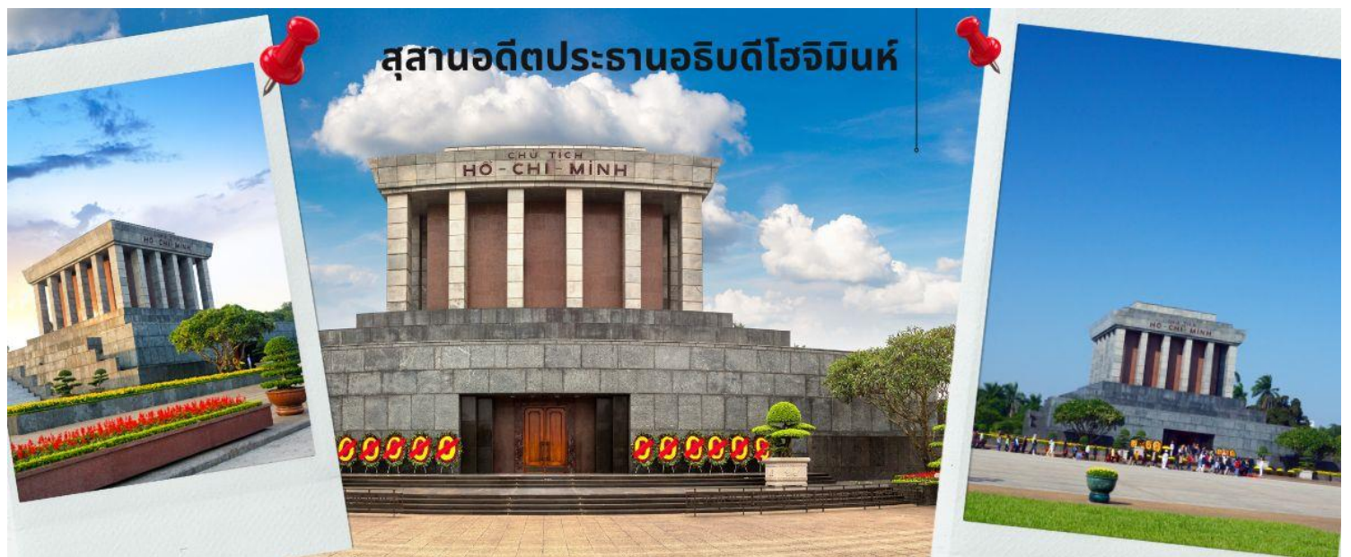
สุสานอดีตประธานาธิบดีโฮจิมินห์

จากนั้นนำท่านเข้าสู่ สุสานอดีตประธานาธิบดีโฮจิมินห์ (ชมด้านนอก) อยู่ที่ จัตุรัสบาติงห์ ใจกลางกรุงฮานอยเป็นสถานที่เก็บศพภายในบรรจุศพอาบนํ้ายาของโฮจิมินห์นอนสงบอยู่ในโลง