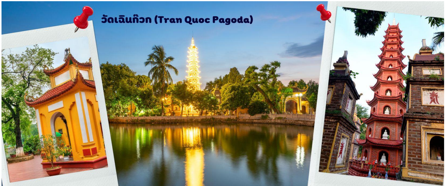
วัดเจินก๊วก (Tran Quoc Pagoda)

จากนั้นนำท่านไป วัดเจินก๊วก (Tran Quoc Pagoda) เป็นวัดที่อยู่ใจกลางเมืองของเวียดนาม ใกล้ชิดกับทะเลสาบตะวันตกของเมืองฮานอย สร้างด้วยสถาปัตยกรรมจีนโบราณ มีความร่มรื่น และบรรยากาศดี จึงเป็นที่นิยมของนักท่องเที่ยวทั้งที่ชื่นชมความงามและมีศรัทธาในพระพุทธศาสนา จากภาพมุมสูงของสถานที่ตั้ง ที่นี่เหมือนตั้งอยู่บนเกาะที่ยื่นลงไปในทะเลสาบ แต่มีเส้นทางคมนาคมเข้าถึงที่ สิ่งปลูกสร้างมีการวางผังเป็นอย่างดี ใช้สีสันทึกลับมกลืนในโทนสีเหลือง น้ำตาล ตัดกับสีเขียวของต้นไม้ใหญ่ที่โอบล้อมอยู่ในมุมถ่ายภาพจากอีกฝั่งหนึ่ง จะเห็นสิ่งปลูกสร้างสไตล์จีน และเจดีย์หลายชั้นโดดเด่น มีภาพที่สะท้อนลงสู่ผืนน้ำ เป็นภูมิทัศน์ที่งดงามทั้งยามกลางวันและยามค่ำคืนที่มีการเปิดไฟส่องสว่าง