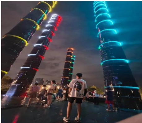
ปลาหมึกเกรดซอส