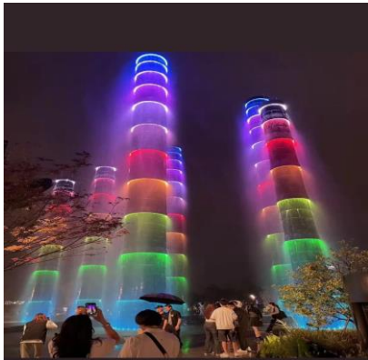
เส้นหมี่น้ำตกเสฉวน

จากนั้นนำท่าน ชมแสงสีไฟ 4 มิติตึกแฝดเฉิงตู มีความสูง221เมตร แร้งบันดาลใจใจในการสร้างตึก โดยมีจุดประสงค์ในการสร้างตึกคือ หม้อไฟหม่าล่า+ตะเกียบ เพราะว่าหม้อไฟหม่าล่า เป็นอาหารเอกลักษณ์ของเฉิงตู กลมๆด้านหน้าตึก คือ หม้อไฟ ตึกแฝดคือตะเกียบนั่นเอง และที่นี้จะเปิดไฟเป็นอนิเมชั่นต่างๆหมุนเวียนไปแบบน่ารักๆ ส่วนใหญ่จะเป็นเกี่ยวกับหมี่แพนด้า รูปวิวสวยๆและฟรีเซ็นเตอร์โฆษณาต่างๆของสินค้าให้ได้ชมอีกด้วย