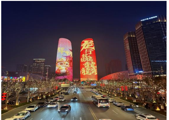
หม่าล่าเสฉวน