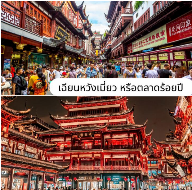
เจียนหวังเมี่ยว หรือตลาดร้อยปี

นำท่านสู่ เจียนหวังเมี่ยว หรือตลาดร้อยปี เซี่ยงไฮ้ เป็นตลาดเก่าแก่โบราณของผู้ตั้งมืออาคารบ้านเรือนรูปแบบสถาปัตยกรรมจีนโบราณสวยงามตั้งแต่สมัยราชวงศ์หมิงและชิง และตลาดแห่งนี้ยังมีของที่ระลึกอยู่เยอะแยะบริเวณรอบๆมีร้านค้า ร้านขนม ร้านอาหารขึ้นชื่อของที่นี่ คือ “เสี่ยวหลงเปา” และยังมีแหล่งช้อปปิ้งอันเก่าแก่ยอดนิยมของชาวต่างชาติ