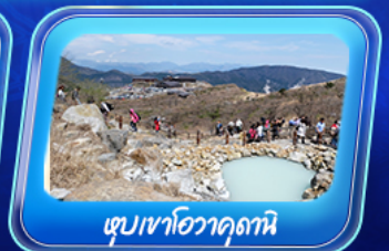
ซุบเขาโอวาคุดานิ