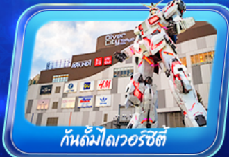
กันดั้มไดเวอร์ซิตี