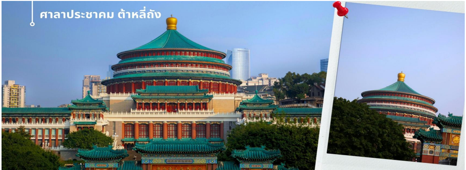
ศาลาประชาคม ต้าหลี่ถิ่ง

นำท่านเดินทางสู่ ศาลาประชาคม เป็นสถานที่หนึ่งในสัญลักษณ์ของเมืองฉงชิ่ง ด้วยสีส้มและรูปแบบการจัดวางอย่าง โดดเด่นและลงตัว มีการผสมผสานของศิลปะในยุคราชวงศ์หมิงและราชวงศ์ชิงเข้าไว้ด้วยกัน ด้านหน้าจะเป็นลานกว้าง ในตอนเย็นและตอนกลางคืนจะมีผู้คนจำนวนมากเข้ามารวมตัวกันทำกิจกรรม ไม่ว่าจะเป็นการเต้นแอโรบิค เดินเล่น ปิกนิก เดินชมแสงไฟยามค่ำคืน จัดนิทรรศการต่างๆ อิสระให้ท่านถ่ายภาพวิวด้านหน้าตามอัธยาศัย