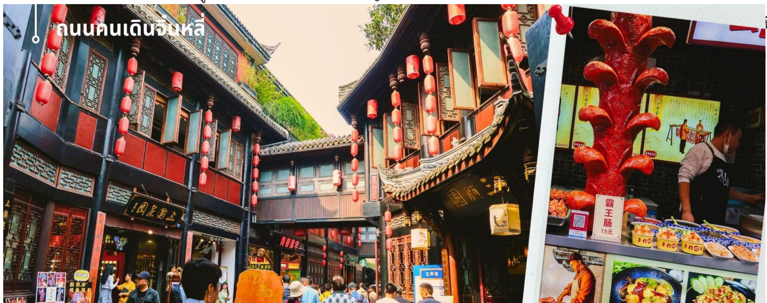
ถนนคนเดินจิ้นหลี่

นำท่านเดินเล่น ถนนโบราณจิ้นหลี่ เป็นหนึ่งในสถานที่ท่องเที่ยวที่น่าสนใจที่สุดสำหรับผู้ชื่นชอบประวัติศาสตร์และวัฒนธรรมจีน หมู่บ้านโบราณแห่งนี้มีความสำคัญอย่างยิ่งในเรื่องของประวัติศาสตร์ที่ยาวนานถึง 1,800 ปี ซึ่งเต็มไปด้วย