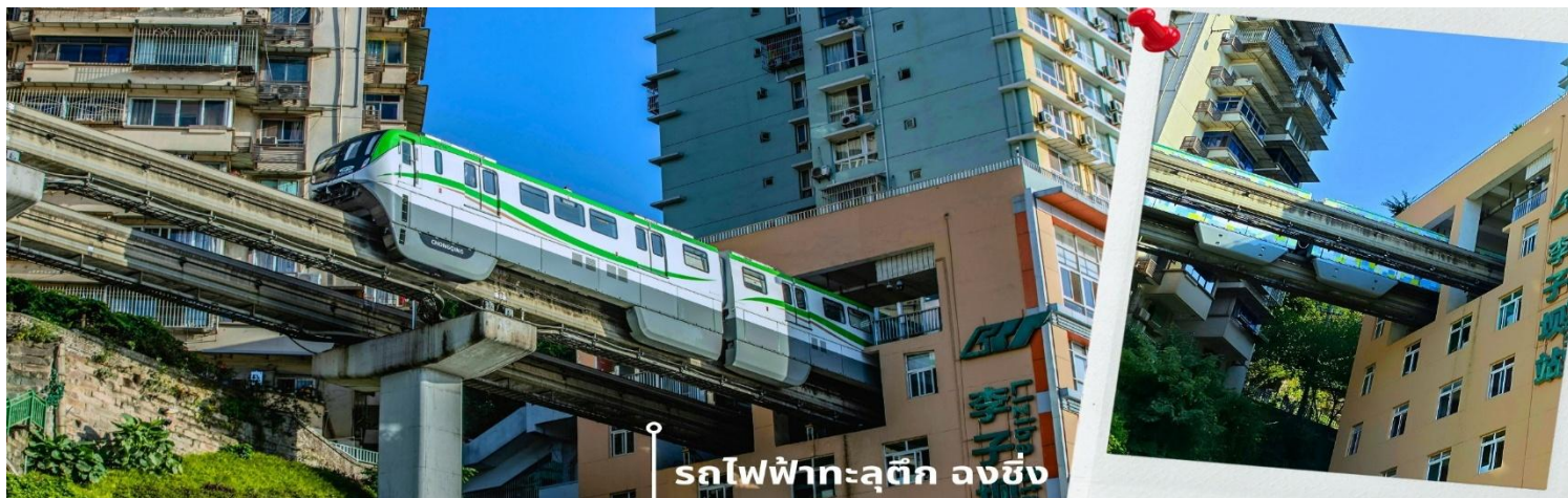
รถไฟฟ้าทะลุตึก จงชิ่ง

ที่ทำให้สถานี Liziba มีชื่อเสียงไปทั่วโลกคือ “เส้นทางรถไฟที่วิ่งทะลุผ่านอาคารสูง 19 ชั้น” โดยมีระบบลดเสียงและแรงสั่นสะเทือน ทำให้ผู้ที่อาศัยอยู่ในตึกไม่ได้รับผลกระทบจากเสียงดังมาก กลายเป็นภาพอันน่าตื่นตาตื่นใจของผู้ที่มาเยือนทั้งนักท่องเที่ยวที่เดินทางมาเป็นครั้งแรก ผู้โดยสารบนขบวนรถไฟและผู้ที่ชมจากจุดชมวิวก็ต่างตื่นเต้นไปตามๆกันกับการที่ได้เห็นรถไฟวิ่งทะลุตึกนี้ สถานี Liziba ได้รับการยกย่องให้เป็น 1 ในสถานที่สำคัญที่สะท้อนความเติบโตของจีนตลอด 70 ปี ซึ่งไม่ได้เกิดขึ้นโดยบังเอิญ รถไฟฟ้าทะลุตึกนี้คือตัวอย่างของความอัจฉริยะใน