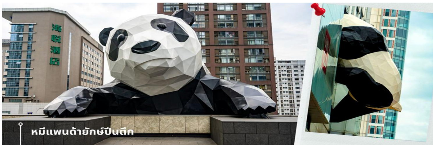
หมีแพนด้ายักษ์ป็นติก

จากนั้นนำท่านชมความน่ารัก อันเป็นเอกลักษณ์ของมหานครเฉิงตู นั่นคือ หมีแพนด้ายักษ์ป็นติก ประติมากรรมที่ชื่อว่า "I Am Here" ซึ่งเป็นหมีแพนด้ายักษ์ที่ตั้งอยู่ที่ IFS (International Finance Square) ในเมืองเฉิงตู ประติมากรรมนี้มีขนาดใหญ่และเป็นผลงานของศิลปินชาวอเมริกัน Lawrence Argent หมีแพนด้าตัวนี้ถูกออกแบบให้ดูเหมือนว่ากำลังปีนตึก และมีส่วนหัวที่โผล่พ้นออกมาจากอาคาร ทำให้เกิดภาพอันน่ารักและน่าประทับใจจากผู้ที่พบเห็นและนักท่องเที่ยว จากนั้นนำเดินทางไปช้อปปิ้งกันต่อที่ POP MART เป็นหนึ่งในแบรนด์ที่ได้รับความนิยมในประเทศจีน มีกลุ่มสินค้าหลากหลายประเภท รวมถึงของเล่นที่ได้รับความนิยมอย่างสูงในหมู่นักสะสม ความน่าสนใจของ POP MART คือการที่จะได้เก็บสะสมโมเดลที่มีเอกลักษณ์ และสินค้าหลายสาขาในฉงชิ่งมีสินค้าพร้อมจำหน่ายโดยไม่ต้องต่อแถวรอคิว สินค้าบางรุ่นมีความหายากและคอลเลกชันพิเศษ เช่น สาย Apple Watch ลาบูบู กระเป๋าผ้าลาบูบู และ Flying