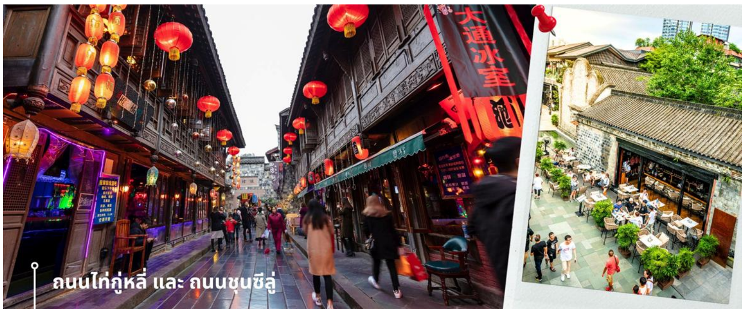
ถนนไท่กุ่หลี่ และ ถนนชุนซีลู่

ให้ท่านให้อิสระกับการเลือกซื้อสินค้าของฝากที่ ถนนไท่กุ่หลี่ และ ถนนชุนซีลู่ ในย่านนี้เป็นถนนโบราณ ในอดีตเคย โรงงานผลิตผ้าไหมใหญ่ที่สุดในจีน ปัจจุบันได้เปลี่ยนเป็นถนนช้อปปิ้งแหล่งสวรรค์ของนักท่องเที่ยว เป็นถนนคนเดินมี ห้างสรรพสินค้าชื่อดัง มีร้านค้ามากกว่า 700 ร้านค้าที่เต็มไปด้วยสินค้าต่าง ๆ ทั้งร้านค้าแฟชั่น ร้านอาหารและโรงแรม นานาชาติมากมายซึ่งเป็นที่เที่ยวเชิงตุ่ที่มีการเชื่อมต่อทางวัฒนธรรมท้องถิ่นที่เป็นแหล่งช้อปปิ้งและเป็นแหล่งร้านอาหาร ที่อร่อยต่าง ๆ มากมาย ซึ่งเป็นสถานที่เที่ยวของเชิงตุ่ที่ทำให้เพลิดเพลินกับสินค้าแบรนด์เนมและแบรนด์จีน เพื่อให้ นักท่องเที่ยวได้เลือกซื้อตามอิสระ