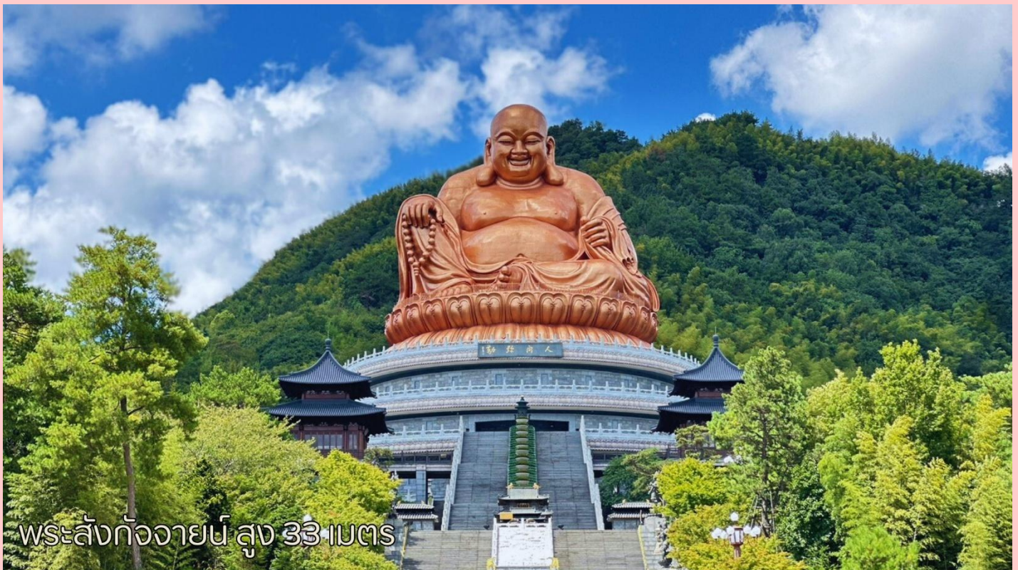
พระสังกัจจายน์ สูง 33 เมตร

พระสังกัจจายน์เพื่อสิริมงคล) สัมฤทธิ์สูง 56.74 เมตร ซึ่งเป็นองค์พระที่สูงที่สุดในโลก บริเวณจุดชมวิวพระพุทธรูปยักษ์ Xuedou คือวัด Xuedou ซึ่งเป็นสำนัก Maitreya ที่เชิงเขา Xuedou วัดนี้ค่อนข้างใหม่และมีขนาดใหญ่ พระศรีอริยเมตไตรยกลางแจ้งขนาดใหญ่ในวัดถือเป็นสถานที่สำคัญที่เห็นได้ชัดเจนในบริเวณจุดชมวิวซีโซ่ว และสามารถมองเห็นได้จากหลายแห่ง