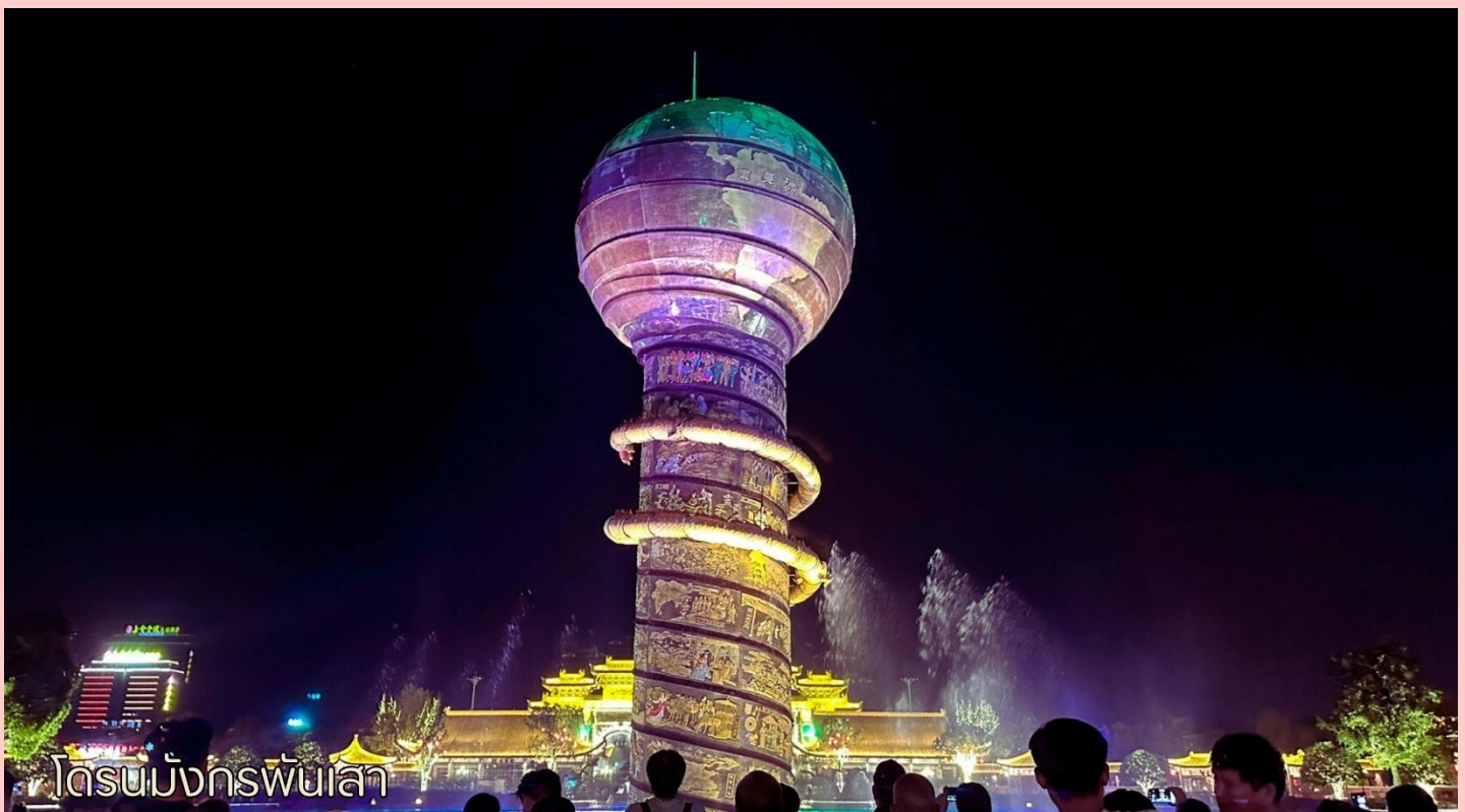
โดรนมังกรพันเลา

จากนั้นนำท่านเดินทางสู่เมืองหนิงไห่ (หนิงปอ - หนิงไห่ ใช้เวลาในการเดินทาง 4 ชั่วโมง) เป็นนครระดับอำเภอในมณฑลเจ้อเจียง และตั้งอยู่ทางตอนเหนือของมณฑลเจ้อเจียง ห่างจากใจกลางนครเซี่ยงไฮ้ไปทางทิศตะวันตกเฉียงใต้ประมาณ 125 กิโลเมตร