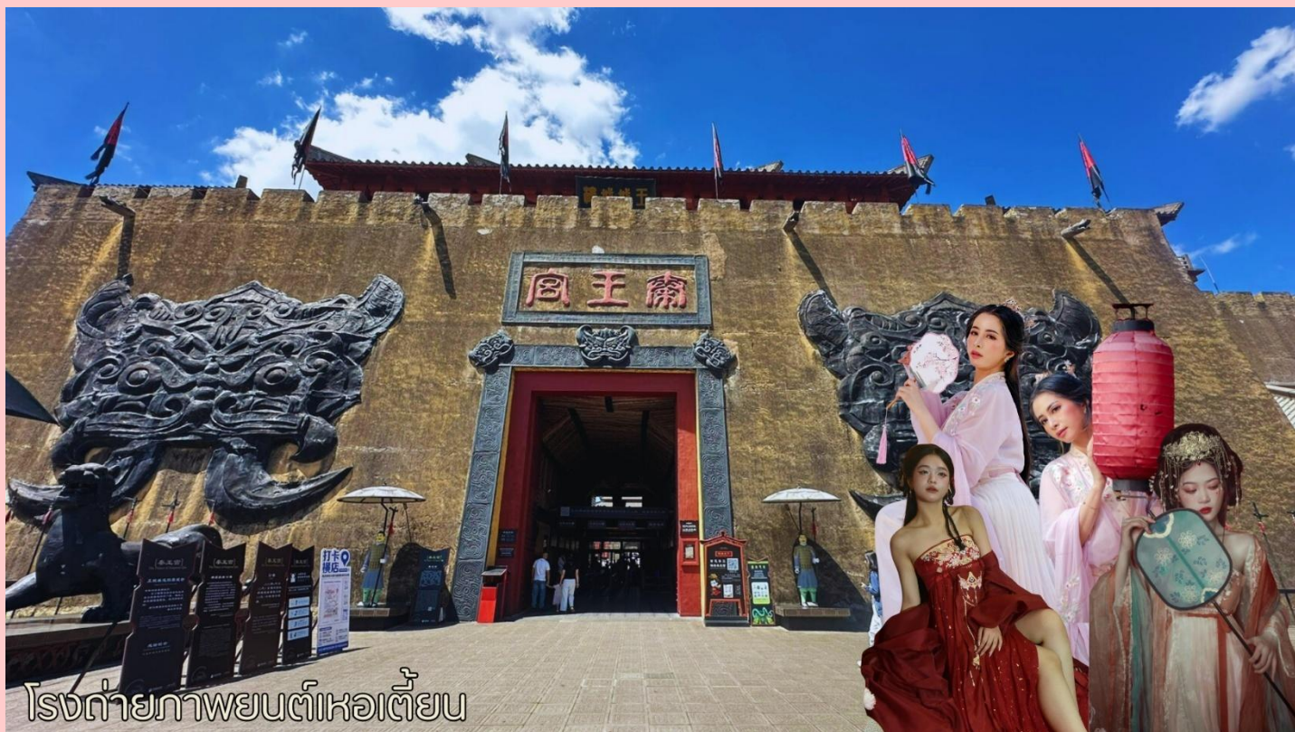
โรงถ่ายภาพยนตร์หวอเตี้ยน

จากนั้นนำท่านเดินทางสู่เมืองหวอเตี้ยน (หนิงไห่ - เหวอเตี้ยน ใช้เวลาในการเดินทาง 3 ชั่วโมง) นำท่านเดินทางสู่เมืองจำลองถ่ายภาพหนังเรื่องจีนซีฮ่องเต้ เป็นสถานที่ถ่ายทำภาพยนตร์และละครโทรทัศน์ที่ใหญ่ที่สุดในโลก ตั้งอยู่ในเมืองหวอเตี้ยน มณฑลเจ้อเจียง มีพื้นที่กว่า 13,000 ไร่ ประกอบด้วยฉากจำลองต่างๆกว่า 700 ฉากจำลองเมืองโบราณต่างๆ ของจีนในยุคต่างๆ รวมถึงฉากจากวรรณกรรมจีนชื่อดัง เช่น สามก๊ก ไซอิ๋ว จีนซีฮ่องเต้ บริเวณโดยรอบมีร้านอาหาร ร้านเครื่องดื่ม รวมถึงร้านเช่าชุดจีน อิสระให้ท่านเดินเล่น หรือเช่าชุดโบราณจีนเพื่อถ่ายรูปตามอัยาศัย