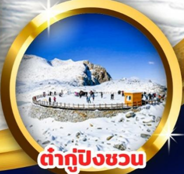
ท่ากู่ปิงชว่น