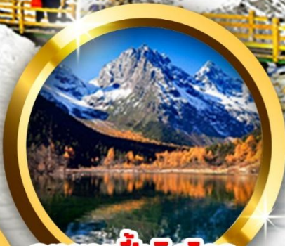
อุทยานปี้เฟิงโกว