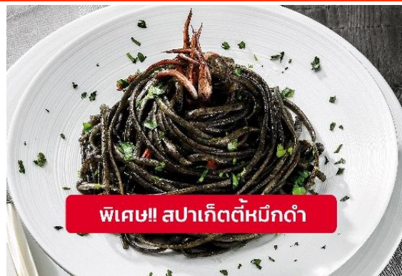
พิเศษ!! สปาเก็ตตี้หมึกดำ

Highlight! เมื่อเยือนเกาะเวนิส เมนูที่ขึ้นชื่อและหากได้มาต้องได้ลิ้มลอง สปาเก็ตตี้ผัดซอสหมึกดำ ที่คลุกเคล้ากับความหอมนุ่มนวลกับบรรยากาศ