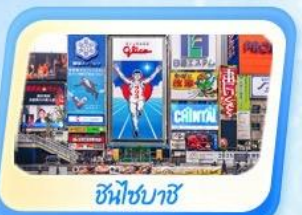
ชินโจชิบาชิ

ที่พักออนเซ็น 1 คืน กิฟู 1 คืน นากาโน่ 1 คืน นาริตะ 1 คืน