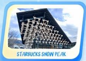
STARBUCKS SNOW PEAK