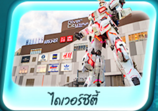
ไดเวอร์ซิตี

Highlight ล่องเรือชมวิวทะเลสาบฮาโกเน่ชมวิวฟูจิ ชิมโซ่ดำหุบเขาโอวาคุดานิ สนุกกับริมน้ำที่ฟูจิเ็น สโนว์ริสอร์ท ซ้อมปิ้งจิวโกเท็มบะเอากั๊กเล็ก สักการะวัดอาซากุสะ ถ่ายรูปกันดั้มสุดเท่ที่ไดเวอร์ซิตี โตเกียว