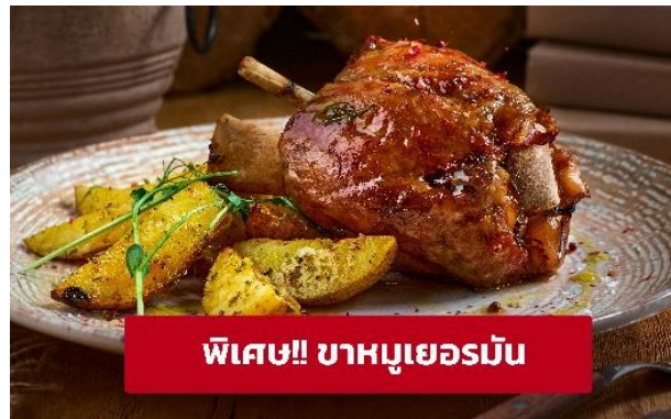
พิเศษ!! ขาหมูเยอรมัน

เที่ยง ๑๐ รับประทานอาหารเที่ยง (มื้อที่6) เมนูพิเศษ! ขาหมูเยอรมัน นำท่านเที่ยวชม เมืองฟุสเซน (Füssen) (ระยะทาง 4 กม./ 30 นาที) ขึ้นชื่อเรื่องความสวยงามของตัวตึกงามบ้านช่องเพราะทั้งเมืองจะมีหลากสีส้มเหมือนกับลูกกวาดสีสวยๆ ทั้งเมืองจนได้รับสมญานามว่า City of candy เมืองเก่าฟุสเซน (Füssen Old Town) เป็นเมืองที่มีเสน่ห์ ตั้งอยู่ในรัฐบาวาเรีย ประเทศเยอรมนี เป็นที่รู้จักจากสถาปัตยกรรมเก่าแก่ที่สวยงาม มีชื่อเสียงในด้านทิวทัศน์อันงดงาม และเป็นเมืองที่มีความสำคัญทางประวัติศาสตร์