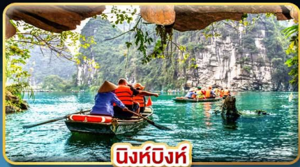
นิงห์บิงห์