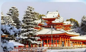
ศาลเจ้าเฮอัน