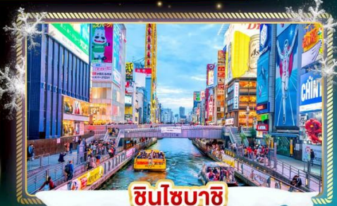
ชินโซบาชิ