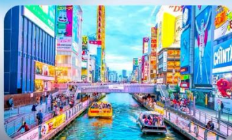
ชินโซบาชิ