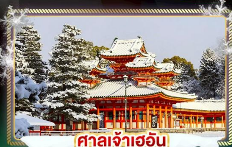
ศาลเจ้าฮอน