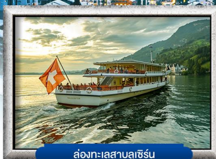
ส่องทะเลสาบลูเซิร์น

✓ Glacier Express รถไฟด่วนที่วิ่งช้าที่สุดในโลก