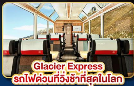
Glacier Express รถไฟด่วนที่วิ่งช้าที่สุดในโลก

เดินทาง : 07-14 ก.ค. | 11-18 ส.ค. | 22-29 ก.ย. 06-13 ต.ค. | 05-12 ธ.ค. 68 | 29-05 ม.ค. 69 31-07 ม.ค. 69