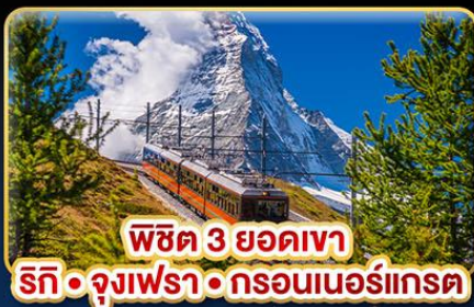
พีชิต 3 ยอดเขา ริก • จุงเฟรา • กรอนเนอร์เกรต