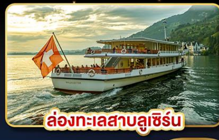
ล่องทะเลสาบลูเซิร์น