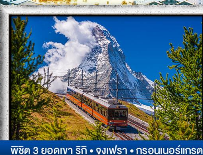
พีชิต 3 ยอดเขา ริทึ • จุงเฟรา • กรอนเนอร์เกรต