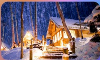
นิงเกิ้ลเทอเรซ