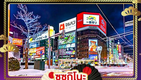
ชูชิโกโมะ