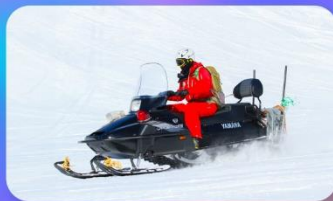
สโนว์โมบิล