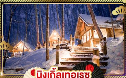
นิงเกิ้ลทอเรซ

📅เดินทาง : 28 ธ.ค. 68 - 2 ม.ค. 69 | 29 ธ.ค. 68 - 3 ม.ค. 69 30 ธ.ค. 68 - 4 ม.ค. 69 | 31 ธ.ค. 68 - 5 ม.ค. 69