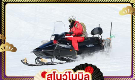
สโนว์โมบิล