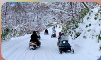
ลานกิจกรรมหิมะ