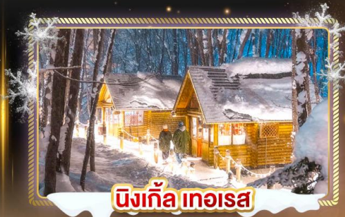
นิงเกิ้ล เทอเรส