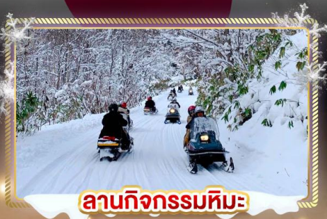
ลานกิจกรรมหิมะ