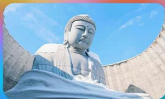
พระใหญ่อะตะมะ